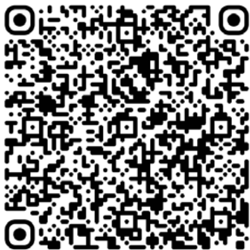
QR kód s odkazem na článek