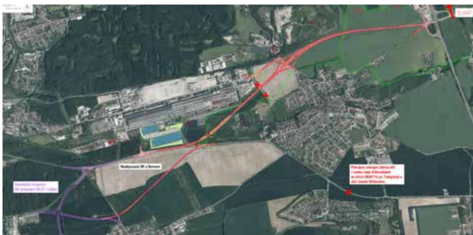
Poslední verze obchvatu (2020)

Debaty o prospěšnosti obchvatu se zde vedou mnoho let a měl jistě i své příznivce. Jako zastupitelstvo si však stojíme za názorem, že zatěžovat krajinu v okolí města další dopravní stavbou, která by město odřízla z další strany od volné krajiny, by bylo neekologické a silně krátkozraké, a spíše než ke zklidnění dopravy by to vedlo k jejímu dalšímu nárůstu. Praxe ukazuje, že pokud se někde postaví nové komunikace, nedojde ke zklidnění dopravy, ale naopak k jejímu nárůstu a zrychlení. Obchvat byl navíc naplánován také skrze údolí potoka pod Poldovkou, kde jsou dnes biokoridory, zahrádky, soukromé chaty i několik obytných domů, z nichž část by musela být vyvlastněna a zdemolována. Část údolí by byla zavezena obřím náspem, který by vyrovnal výškový rozdíl trasy v tomto mimochodem velmi klidném a hezkém úseku krajiny. Ten, kdo namítá, že mezi Buštěhradem a haldou není žádná příroda, a diví se, co prý tu chceme chránit, se velice mýlí, a může to znamenat jediné, že moc nechodí ven a nezná okolí města. Vždyť i toto je krajina, kupodivu místy velmi malebná, ve které existuje nějaký ekosystém, žijí rostliny a živočichové, kteří se přesouvají, lidé, kteří zde chodí, a pokud by tento