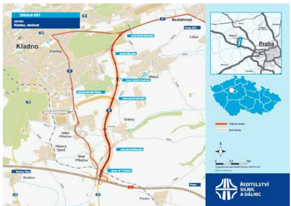
Obchvat Přítočna, nyní ve výstavbě

Od konce roku 2014 do současnosti, kdy je ve vedení města většina zastupitelů z nezávislého sdružení SPOLEČNĚ, však byl názor zastupitelů na obchvat diametrálně rozdílný. Opakovaně jsme Kraj žádali o přehodnocení účelnosti obchvatu. V jednu chvíli byla na stole i kompromisní varianta vedení obchvatu skrze průmyslovou zónu a těsně podél haldy v místech již existující komunikace, která se nejevila tak problematicky, tuto variantu však vzápětí samo ŘSD odmítlo s tím, že v průmyslové zóně by bylo příliš mnoho napojení a nemohla by to být komunikace I. třídy. O variantách proběhla vášnivá debata na zasedání v srpnu 2020, kde zastupi-