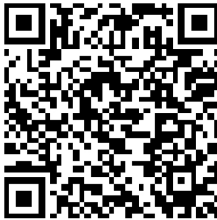
QR kód pro příspěvek na obnovu zvonice

la designu a řemesel Kladno provádí jejich odbornou renovaci a současně podle nich vyrábí kopii.