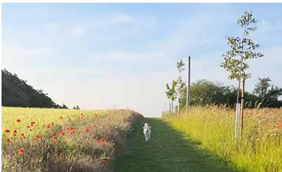
Krajina u haldy, foto J. Mrkvička