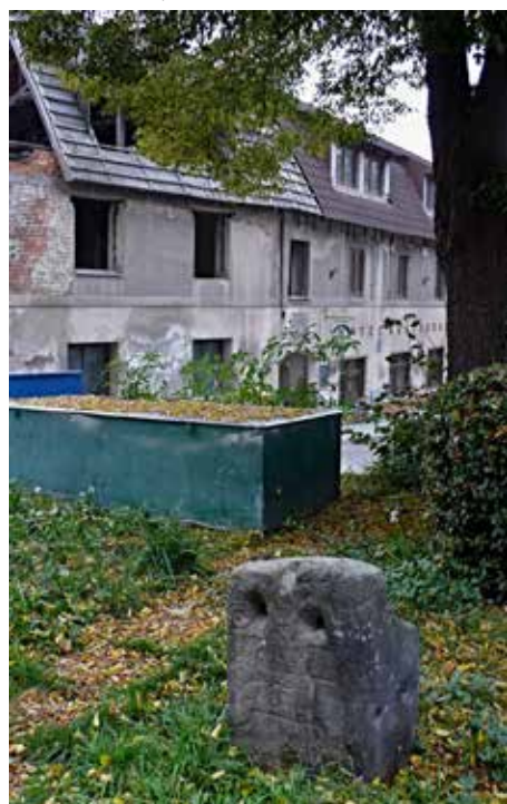
Pranýř v roce 2017