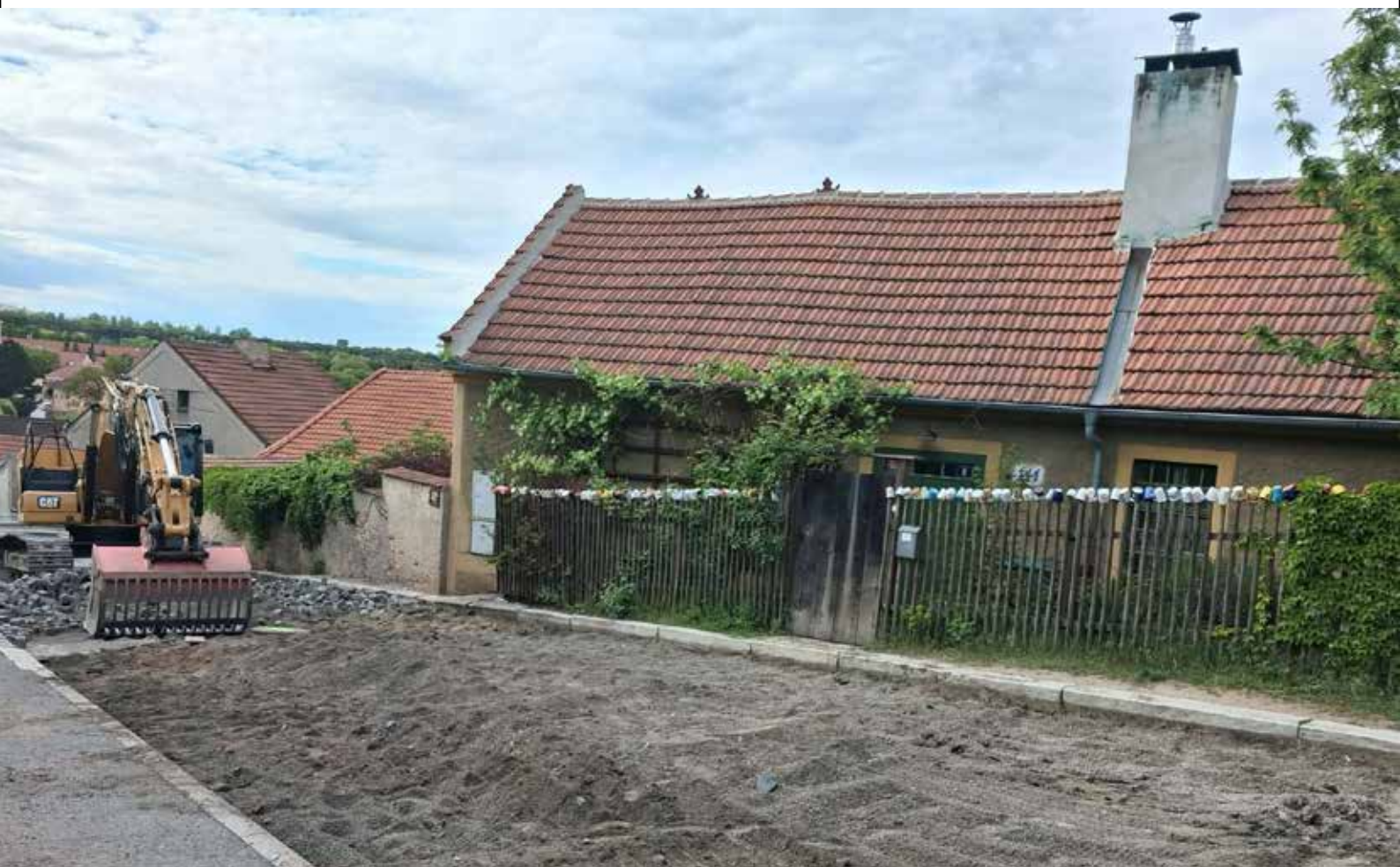
V průběhu prací