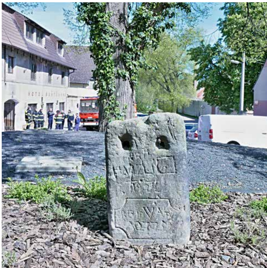
Pranýř v roce 2023