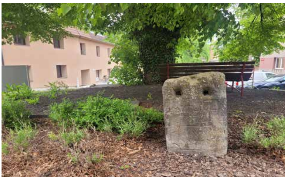
Pranýř v roce 2026