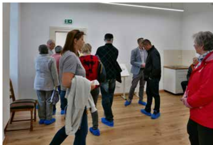
Prohlídka zámku