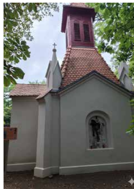
Vizualizace budoucího stavu