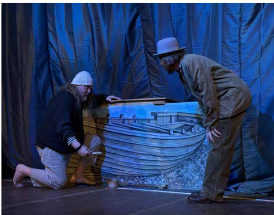
Na jevišti vzniklo i mořské pobřeží s lodkou.