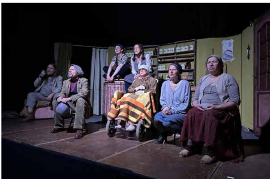
V krámku tet Osbournových se na projekci filmu sešla celá vesnice.