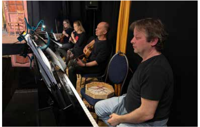
O živý hudební doprovod se postarali čtyři výborní hudebníci.