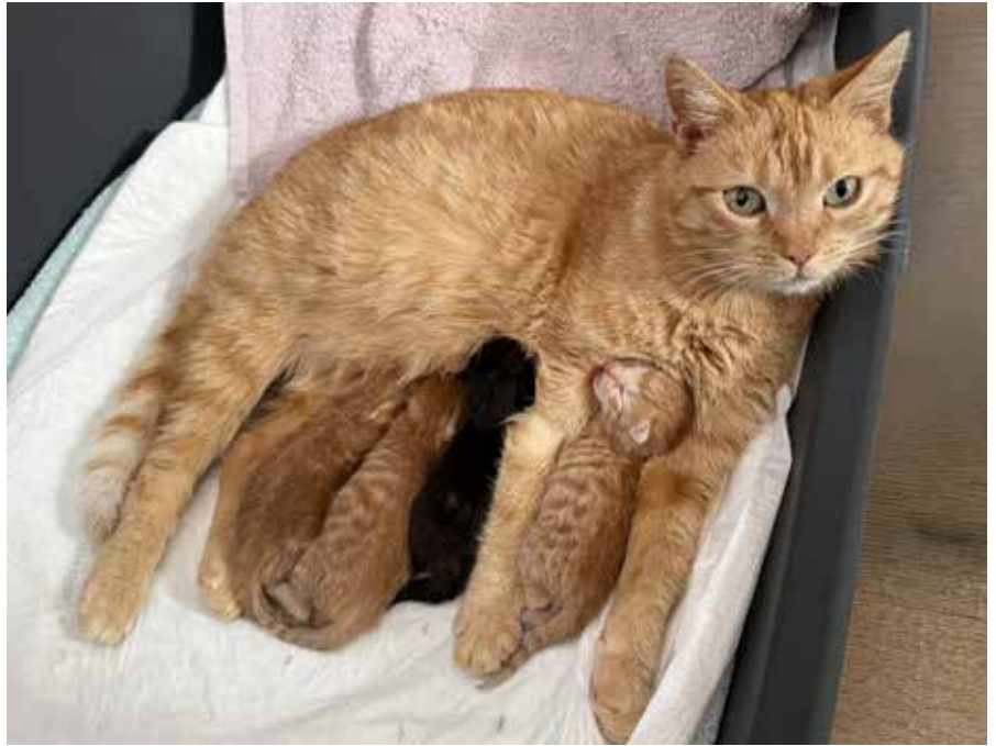
Nalezená březí kočička Zrzinka v Buštěhradu mohla již porodit v teple a klidu

Chcete se stát naším dobrovolníkem? Ozvěte se na: nadejetlapkam@gmail.com