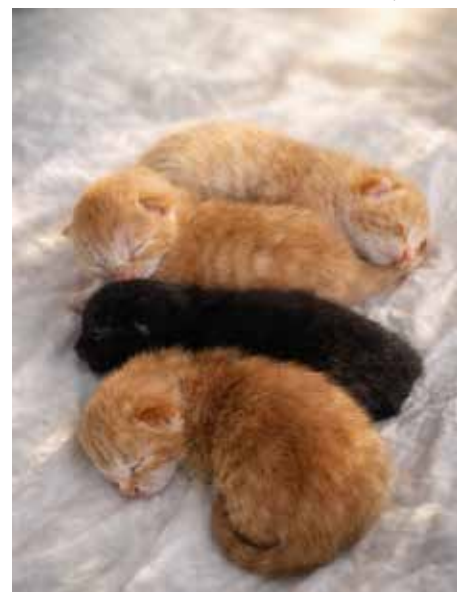
Všechny kotátka Zrzinky jsou již zarezervována a až nastane čas, tak odejdou do nových domovů.

17. května 2026, kde vám rády povíme o naší činnosti. Za každý pří-