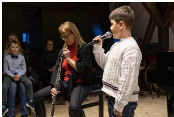
Koncert 19. 2. 2026