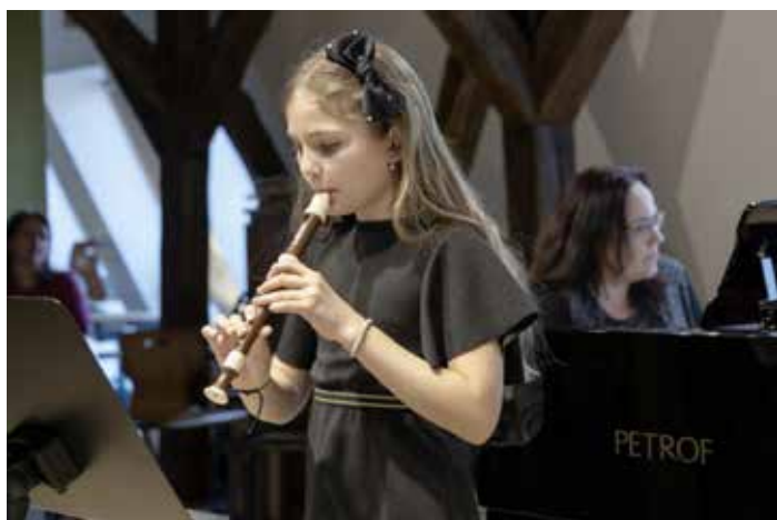
Koncert 19. 3. 2026