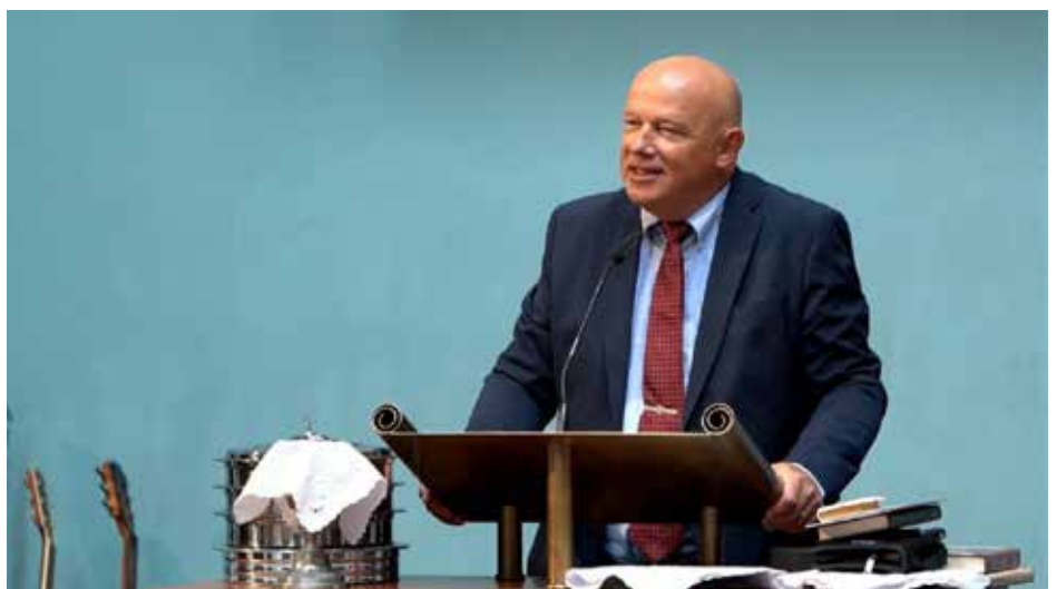
Přednášková činnost

poznámka redakce: knihu Snubní prsten za život lze zakoupit v Infocentru Buštěhrad