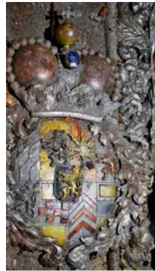
Erb na sarkofágu 1. manžela Filipa Viléma Augusta, hraběte Falckého z Neuburgu

V překladu: Zde odpočívá Její královská Vysost, nejjasnější kněžna a paní, paní Anna Maria Františka, ovdovělá velkovévodkyně Toskánská, rozená vévodkyně Sasko-lauenburská a vestfálská, která se narodila 13. června léta Páně 1672 a dne 15. října léta Páně 1741 v Pánu blaženě zesnula ve věku 69 let, 4 měsíců a 5 dnů.