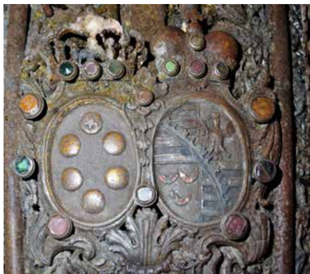
Spojené erby rodu Medici spolu se sasko-lauenburským na předním sarkofágu.