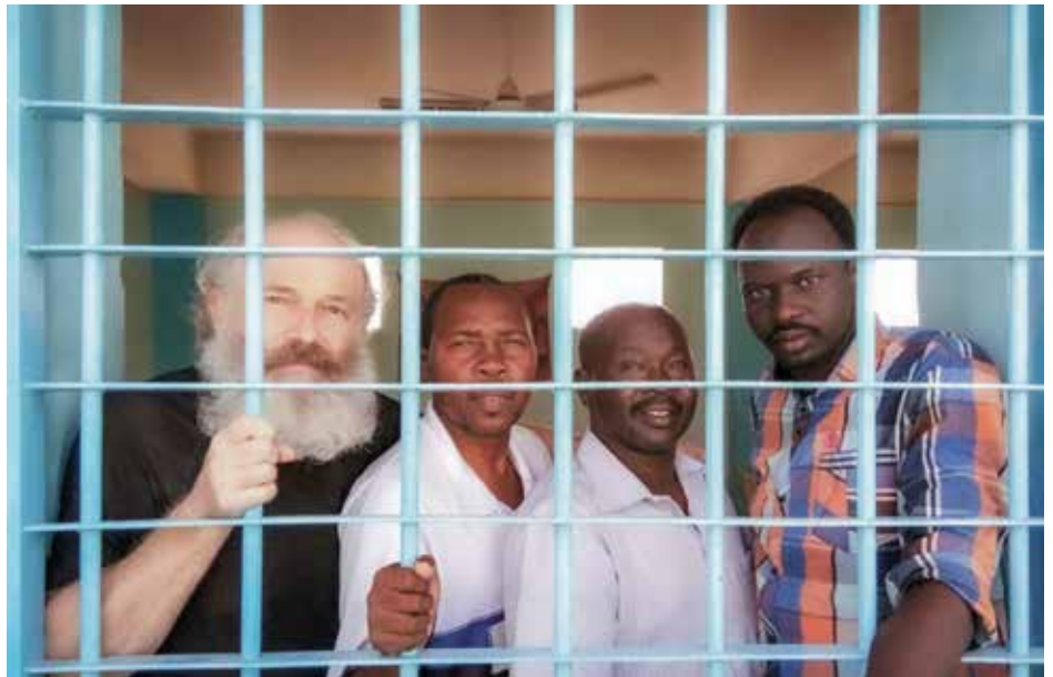
Vězení v Súdánu

Ano. Po 445 dnech ve vězení člověk zažije silný kulturní šok. Návrat byl postupný – rozhovory, cesty, psaní knihy. Kniha doposud vyšla ve 23 jazycích a otevřela mi novou roli: místo dokumentování pronásledování spíše koordinuji mezinárodní práci organizací, které pomáhají pronásledovaným křesťanům, a sdílím příběh tam, kde o něj lidé stojí.