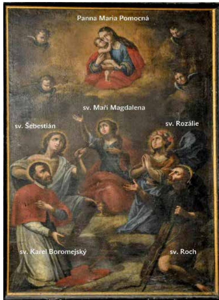
Obraz Panny Marie Pomocné se sv. Maří Magdalenou a morovými patrony, foto k článku Namísto morového sloupu obrazů na str. 17–18