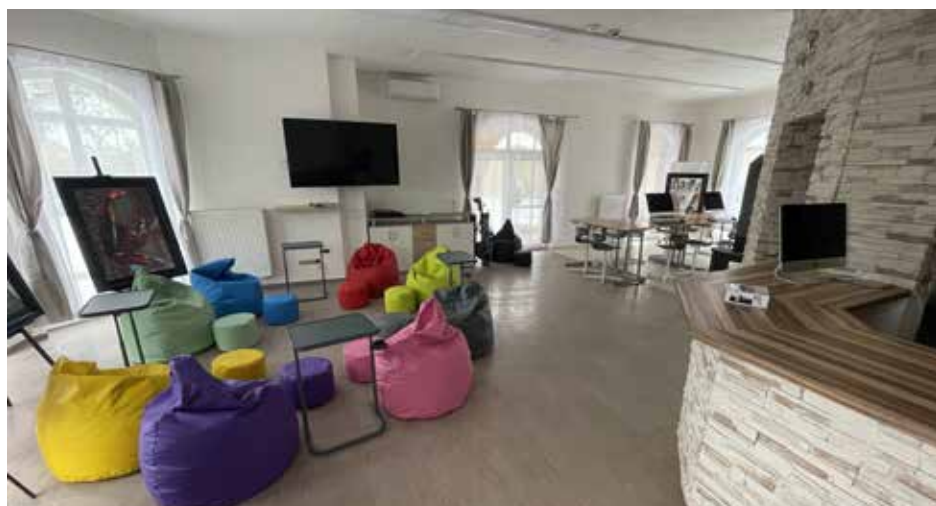
Třída školy

k tomu. Zmíněnou návnadu probírali velmi obsírně, aniž by si povšimli, že jsou zde ještě další menší částky za školné a že pro tělesně postižené bude školné i zdarma. Největší poprask vzbudil obor youtuber a esporty. Jako si ještě v 19. století velmi špatně společensky stáli herci a muzikanti (žádný měšťák by své dítě nechtěl vidět v té komediantské chásce či u šumarů), podobně se diskutující pozastavovali nad něčím tak úděsným, jakože by jejich dítě mohlo být youtuberem. Vždyť ho něco podobného přeci nemůže uživit! Při probírání tohoto oboru si nevšimli, že škola nabízí ještě řadu dalších možností studia – viz níže.