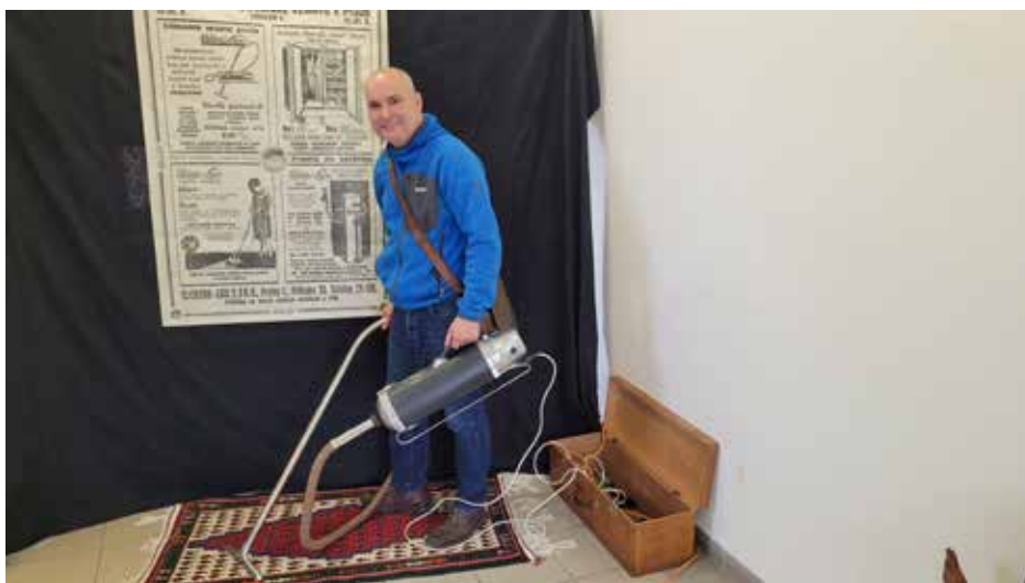
Fotokoutek s luxem – první návštěvník akce, který přijel až z Opavy