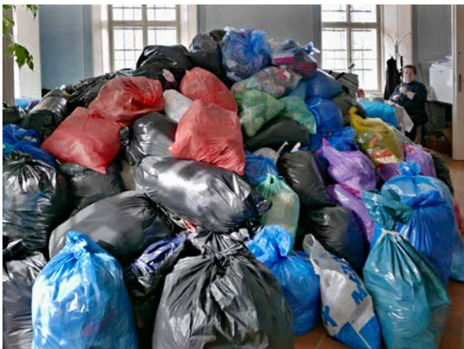
Strážkyně pokladu Zdena Doležalová