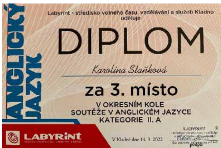
Diplom, foto M. Booth, učitel anglického jazyka ZŠ Buštěhrad