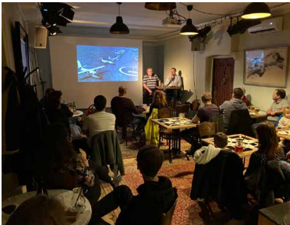
Momentka z besedy, foto J. Žitník

zkoušejí se různé extrémní letové manévry a letadlo musí být schopné všechny bezpečně zvládnout. Nový