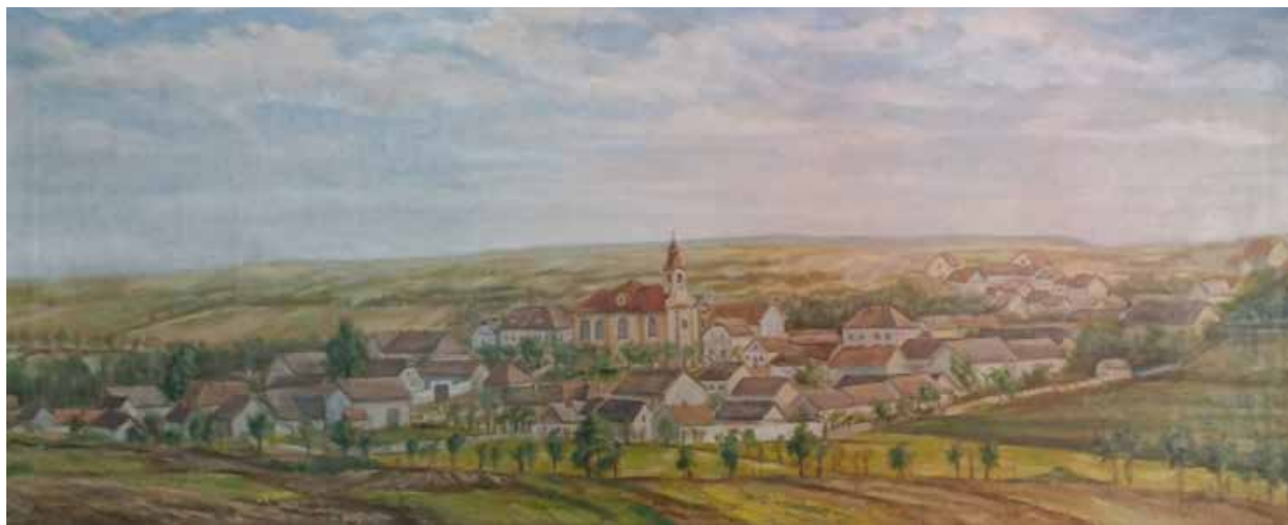
Darovaný obraz Staré Lidice