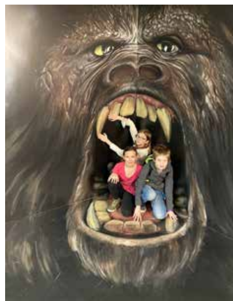
5. B. v expozici muzea, foto M. Hauserová