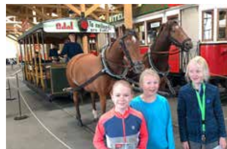
Návštěva Muzea MHD ve Střešovicích

V muzeu jsme dokonce hledali trpaslíčky a všechny jsme našli. Po prohlídce jsme nasedli do tramvaje T3 – Měsíček – a vyrazili po Praze. Trasu jsme si zvolili sami. Cestou jsme viděli to nejzajímavější z hlav-