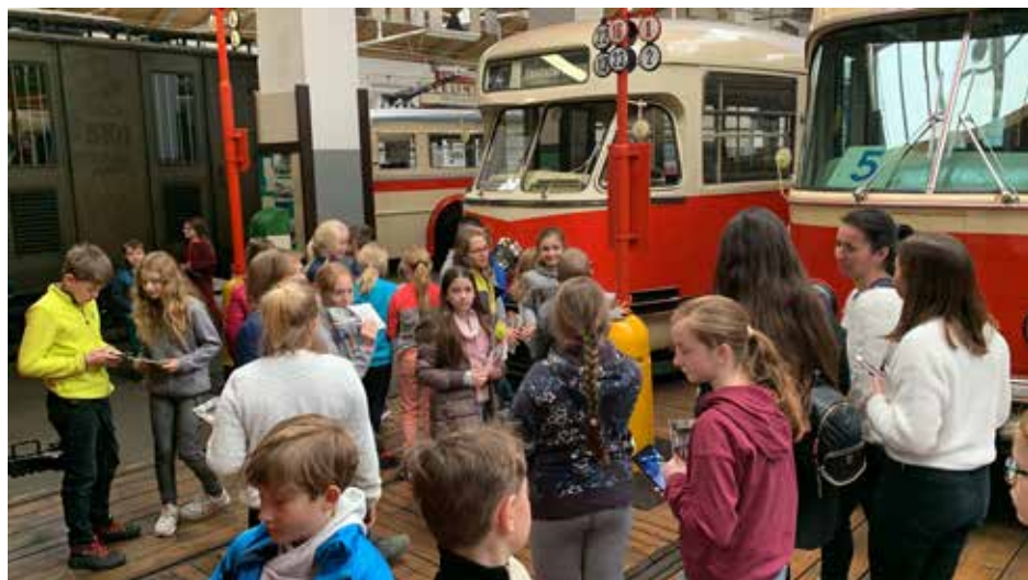
Návštěva Muzea MHD ve Střešovicích

ního města – Pražský hrad, Rudolfinum, Národní divadlo, Karlův most, Tančící dům, Karlovo náměstí, Václavské náměstí, Národní muzeum, Obecní dům, Národní galerii a konečná byla ve Stromovce. Tam jsme přeběhli do planetária, kde nás čekala přednáška o vesmíru s pohádkou Polaris. Pak už jen doběhli ke Spartě