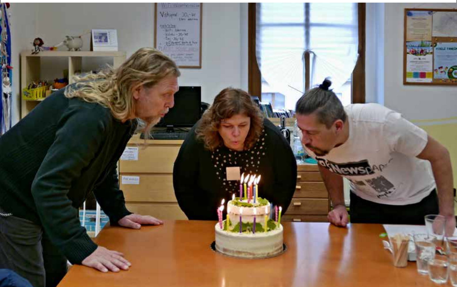
Tak na dalších 20 let!!! Foto k článku Oslava 20 let Buštěhradského muzea Oty Pavla na str. 11–12