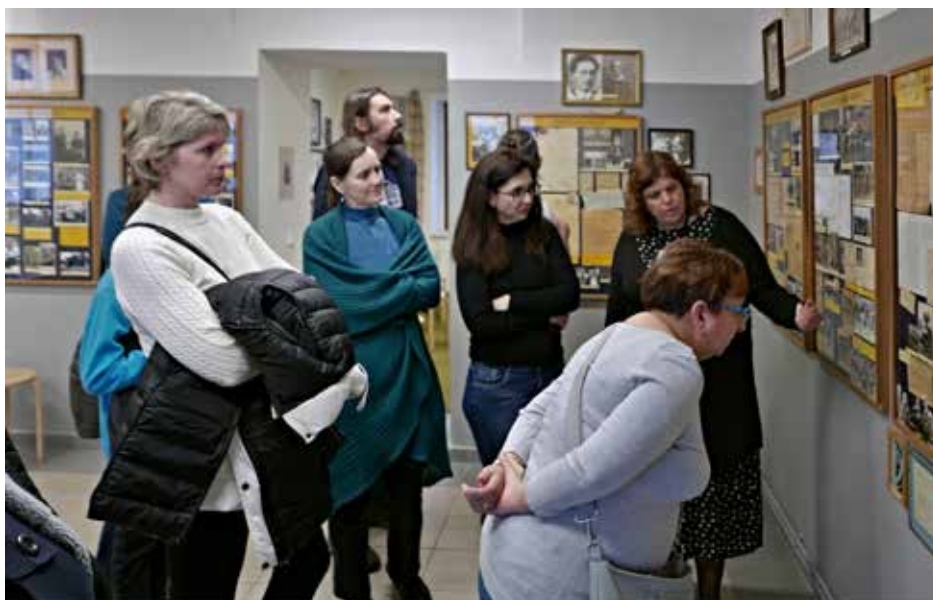
Komentovaná prohlídka, foto J. Pergl