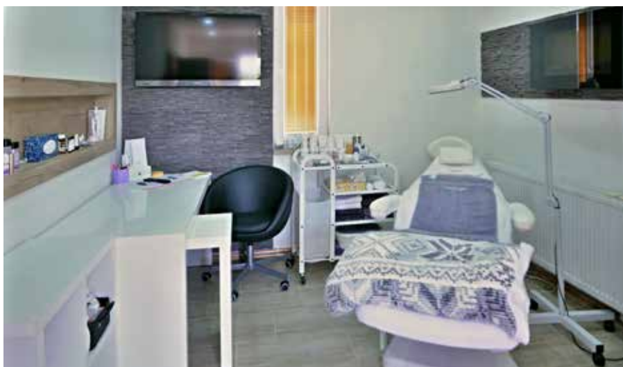
Kosmetický salón