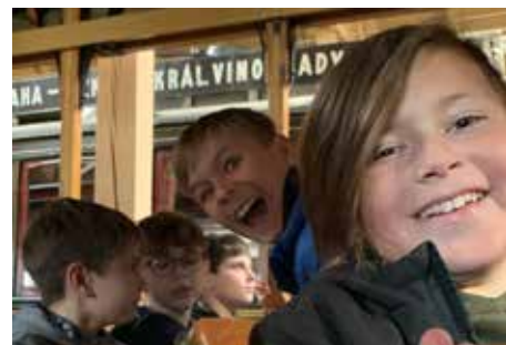
Návštěva Muzea MHD ve Střešovicích