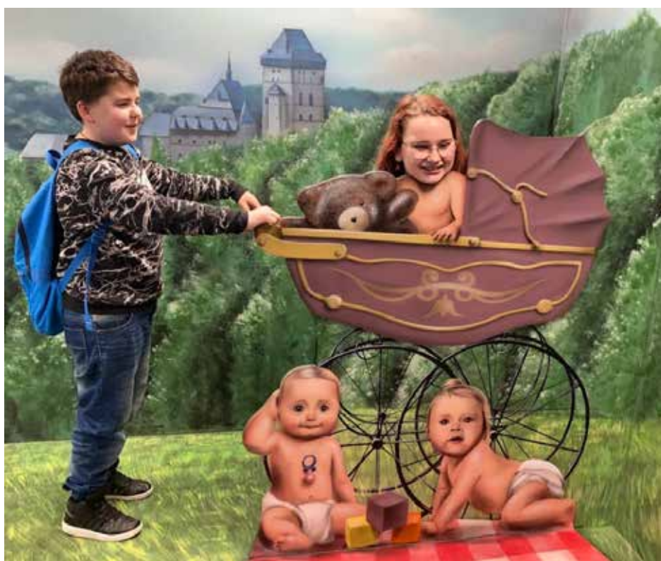
5.B. v expozici muzea

Když jsme si všechno všichni prohlédli, daly nám Mari s Renčou velkou volnost a mohli jsme si jít nakoupit svačinu do Billy, která je hned