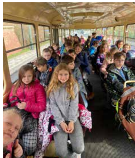
Jízda v historické tramvaji