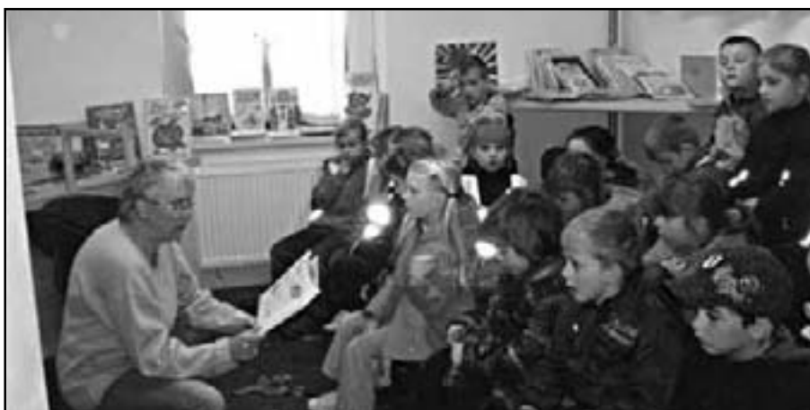
Školka, 3. a 4. třída v knihovně

Mnoho lidí si myslí, že knihovna slouží jen k půjčování knih, ale tak to zdaleka není. Knihovna by měla získávat a vychovávat nové čtenáře. Během měsíce března zavítali do knihovny děti z mateřské školky, žáci prvních, druhých, třetí a čtvrté třídy základní školy. Děti se dozvěděly, jak postupovat, aby se mohly stát čtenáři knihovny, už vědí, jak se chovat ke knihám, že každá knihovna má svůj knihovní řád, co je vypůjční doba i upomínka.