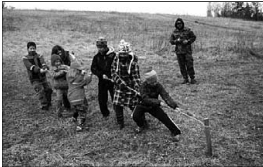
Táhli, táhli a vytáhli

V neděli, když už se pomalu blížil náš odjezd, navštívily děti ještě pohádku O řepě a pomohly vytáhnout babičce a dědečkovi velikánskou řepu. Také se ocitly ve filmu S tebou mě baví svět, kdy se k Albertově nelibosti snažily získat staré talíře po babičce. Čas utekl jako voda, všechny hry byly odehrány a přiblížil se čas odjezdu. Ale