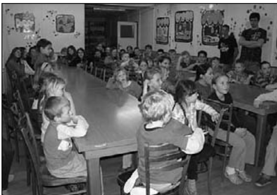
Úvodní setkání a rozdělení do skupin

Prvním filmem, ve kterém jsme se ocitli, byla detektivka. Děti se setkaly se Sherlockem Holmesem a jeho věrným pomocníkem Watsonem. Sherlock přišel za dětmi s prosbou o pomoc, jelikož si sám nevěděl rady s případem, kterým se zrovna zabýval. Řešil nedávno provedenou loupež banky, kdy byly zaznamenány podobizny pachatelů, ale nebyla zjištěna jejich pravá totožnost. A proto přišel