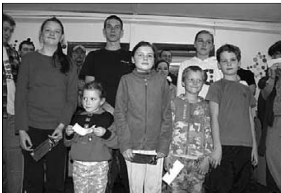
Táhli, táhli a vytáhli