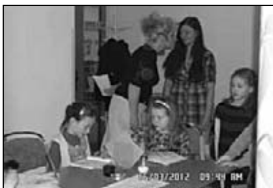
Čtení babičkám a dědečkům

Minulý měsíc byli prvňáčkově oficiálně pasování na čtenáře a nemohli se dočkat svého prvního veřejného čtení. Dne 16.3. žáci z 1.A a 1.B navštívili Dům s pečovatelskou službou v Buštěhradě, aby navštívili babičky a dědečky a potěšili je svým vystoupením. Senioři i personál děti přivítali s vřelým nadšením a děti se nemohly dočkat, až jim budou