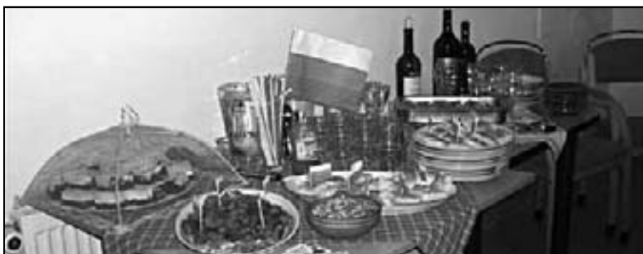
Bulharské odpoledne v DPS