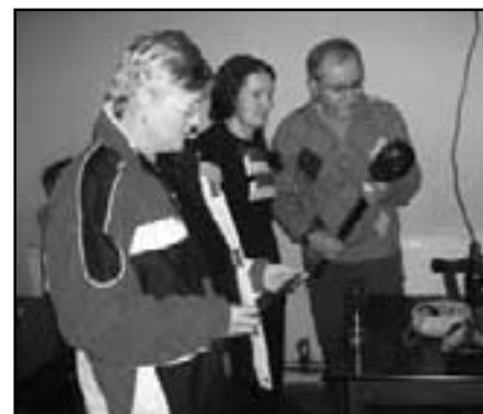
Přednáška o Ugandě