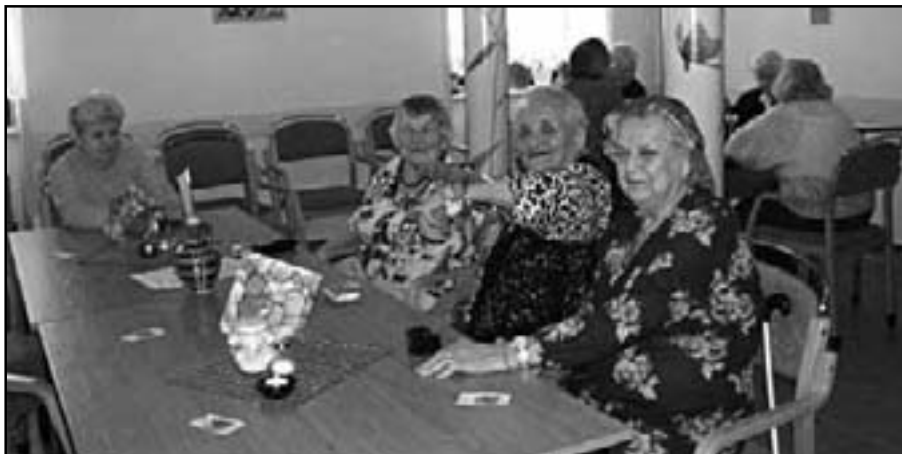
Bulharské odpoledne v DPS