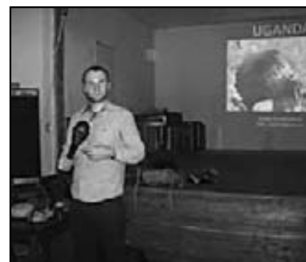
Přednáška o Ugandě