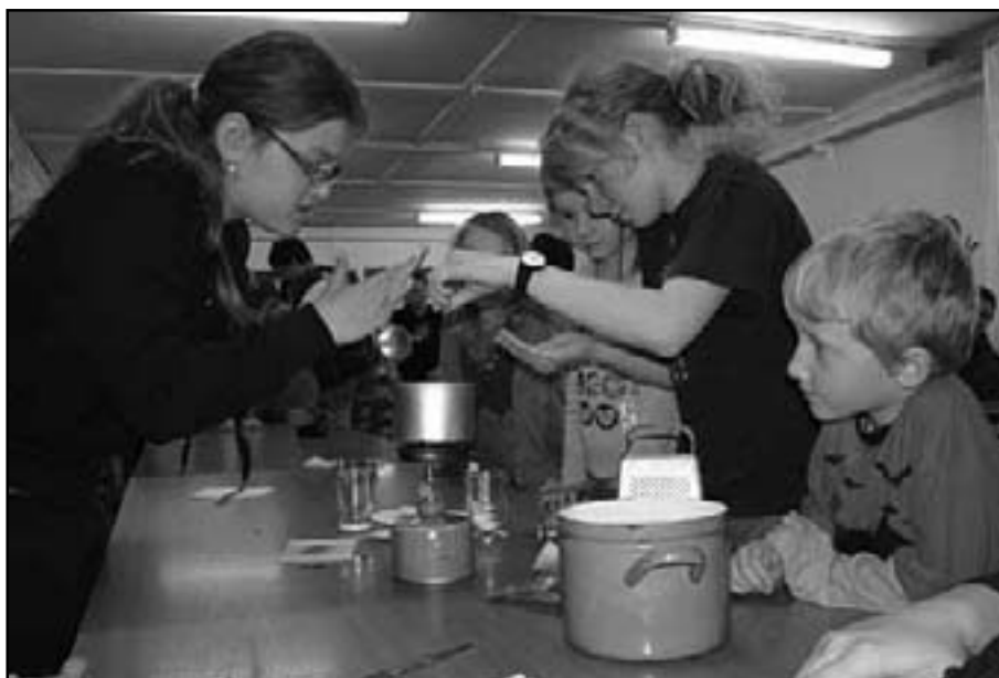
Příprava lektvaru na záchranu Bradavic

V sobotu večer je čekal další nelehký úkol – noční etapa. Mladší děti se ocitly v příběhu Magické zrcadlo čarodějky Magiky, kdy musely před samotnou čarodějnici ukrýt předmět, po kterém tak moc pátrala a kterého se pomocí zrcadla snažila zmocnit. Zatímco starší děti se prostřednictvím filmu Akta X