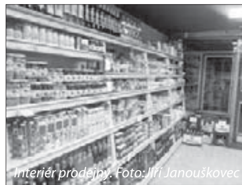
Interiér prodejny.