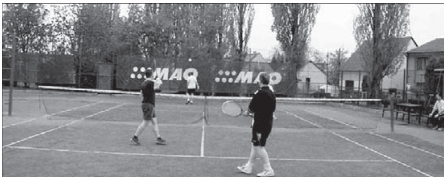
Pohled na buštěhradský tenisový dvorec.