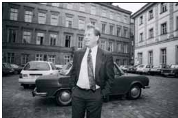
V.H. © MARTIN AUSHAUS