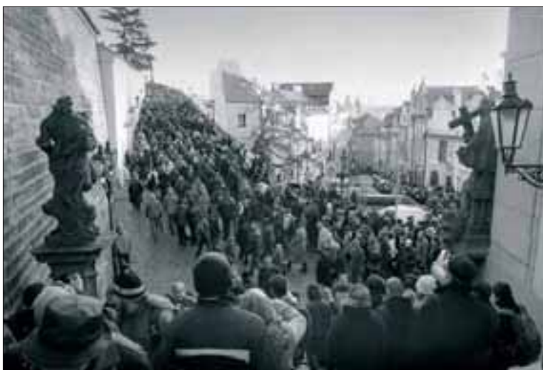
Smuteční průvod