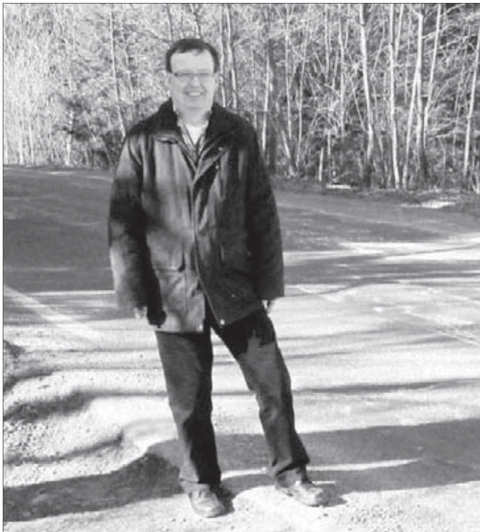
Náměstek Středočeského kraje