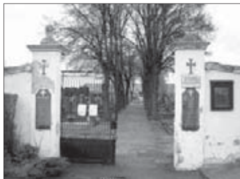
Vstup do buštěhradského hřbitova