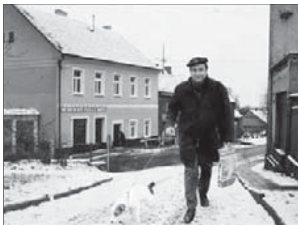
Ota Pavel jde svou ulicí od svého muzea. Fotomontáž Michal Cihlář.

O. s. Buštěhrad sobě se aktivně zabývá záchranou pivovaru Buštěhrad a sleduje dění ohledně bioplynové stanice.