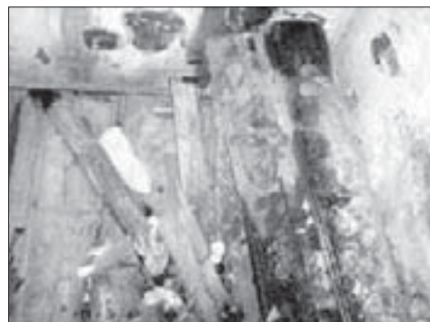
Pohled do odkrytého hrobu

fiktivní rozhovor zapsal a fotografie pořídil Jiří Janouškovec dne 9.12.