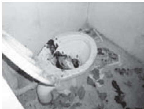
Stav záchodků na hřbitově