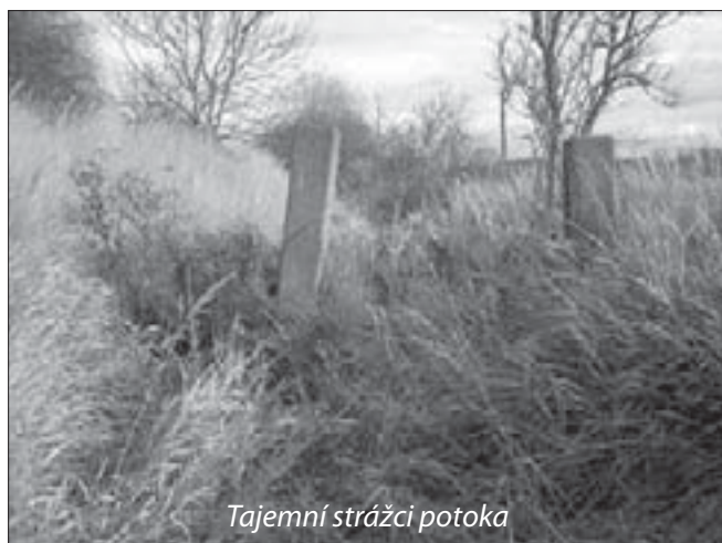
Tajemní strážci potoka

Náhle se dosud rovný směr koryta ztrácel v mírné zátočině doleva vzhůru. Když jsem prozkoumával hustý travní a keřovitý porost, spatřil jsem odlesk od slunce. Vodní hladina? Bylo tomu tak. S překvapením jsem hleděl na systém kaluží, nad kterými šustili křídly vyplašení ptáci a bažanti. Bylo to opravdu velké hejno ptactva, které zde mělo svůj úkryt a zdroj vody. V přímém směru prostor končil terénní stěnou a vpravo sice trochu výše voda byla, ale netekla. V kaluži pouze rezavěly plechové rozbité sudy. Vrátil jsem se tedy trochu zpět, protože mírně vlevo byl patrný rovněž jakýsi průchod pro možné pokračování vody. Musel jsem houštinu trochu obejít a jaké bylo mé překvapení, když jsem opět našel vodu, ale již tekoucí! Několikrát jsem se ujistil, že voda skutečně teče a ztrácí se dále v kalužích, které jsem viděl před tím. Místo bylo porostlé stonky travin, ale jinak dobře přístupné, Zvěčnil jsem