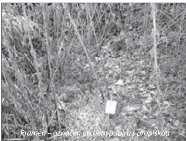
Pramen – označen archem papíru s propiskou

Minul jsem cestu, která přetínala můj směr, a která vedla k fotovoltaickým panelům. Sem tam se v korytu objevovaly vrby. Minul jsem i nivelační značky chráněné betonovou skruží. Místy byla půda v místě koryta rozpraskaná jako vyschlá zem na poušti, ale byl to klam. Po zatížení se