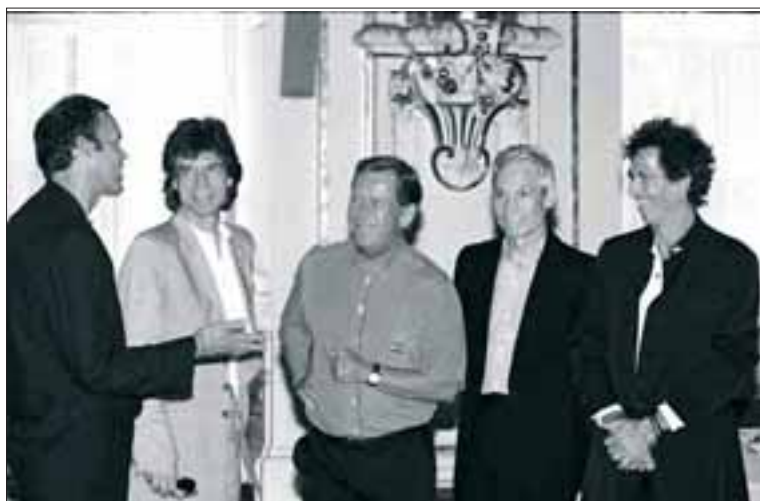
Havel a Rolling Stones