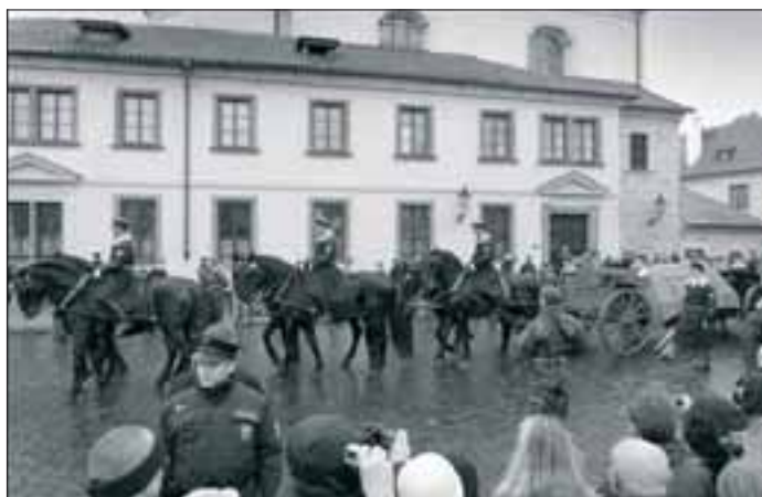
Lafeta © KATEŘINA HOMOLOVÁ