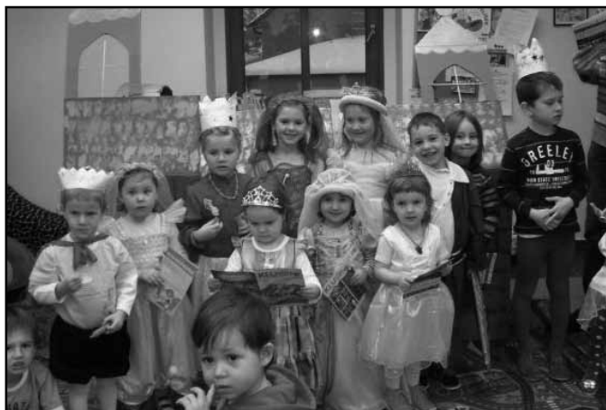
Odpoledne s pohádkou Princezna na hrášku