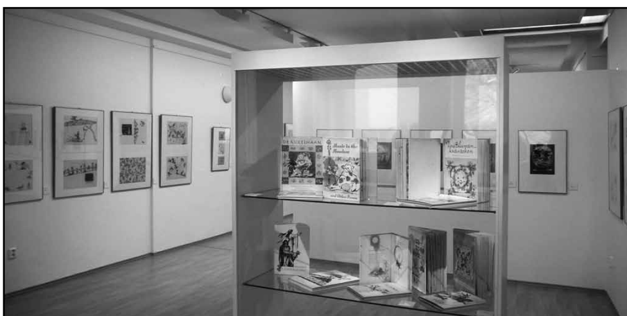
Výstava Pocta Adolfu Záborskému