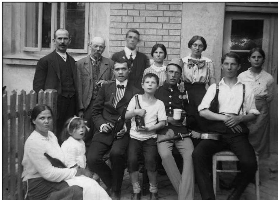
Staré skl. negativy

Co se týká starých fotografií, obdržel jsem kolekci zhruba padesáti skleněných fot. desek (negativů), bohužel bez jakékoliv identifikace. Kolekce zřejmě pochází od jedné rodiny, časově se dá podle oblečení odhadnout na dobu před 1. svět. válkou. Příkládám dva pozitivy, zda někdo z pamětníků