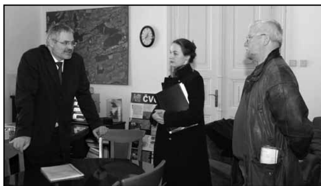
Předání petice primátorovi města Kladna