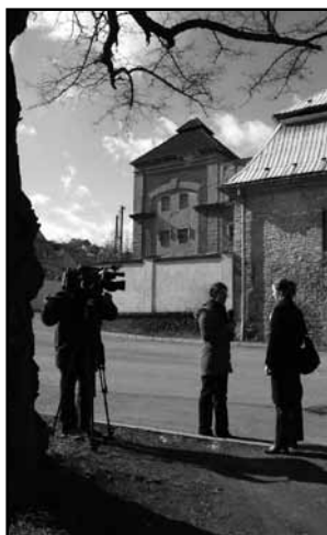
Natáčení ČT 1 – Události v egionech