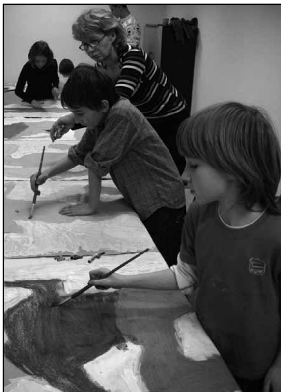
Dílka s tématem Zima na sněhu i na blátě se uskutečnila 16. 1. 2010.