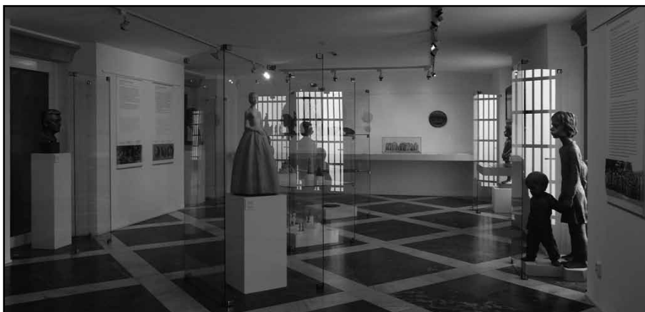
Výstava Pocta Marii Uchytilové