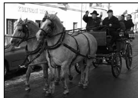
příjezd ředitele

Oficiální řeči vystřídaly debatní kroužky pamětníků i současníků. Starosta města Václav Nový podotkl: „Není jednoduchá záležitost být zřizovatelem školy, ale v porovnání se základními