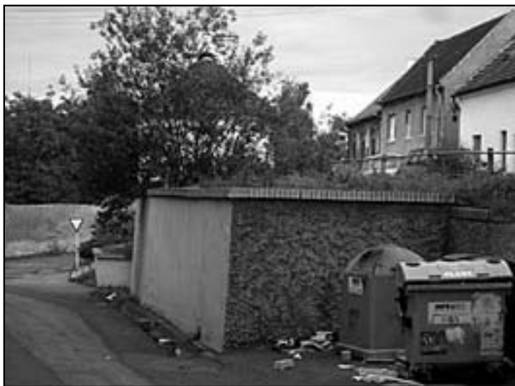
Bývalý vstup do sklepů

Dálkové podzemní trasy pak údajně protínají naši republiku sítí přímočarých směrů mezi vzdálenými objekty. Vedení takových tras se často shodovalo s vedením povrchových cest, bylo často značeno kapličkami, božími mukami, památnými stromy nebo sochami světců. Avšak jen málo přesných plánů a údajů v análech přivádí