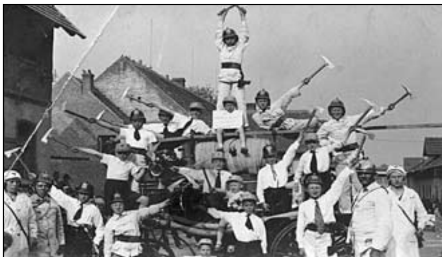
Hasičská stříkačka – rok 1934

Sbírka Památníku Lidice a vlastně celé jeho muzeum jsou poněkud zvláštní. Muzeum má dokumentovat dějiny obce, které byly ale násilně přerušeny, obec na nějaký čas zanikla. To by samo o sobě až tak zvláštní nebylo, zaniklých obcí je i u nás povícero, jenže Lidice, jak známo, byly vyhlazeny. Ze samé podstaty tohoto brutálního činu tedy vyplynulo, že se z dějin obce do roku 1942 nemělo dochovat NIC. Vzhledem k příslovečné nacistické důkladnosti se to vlastně podařilo. O tom, jak si s touto zcela ojedinělou situací lidické muzeum a tvůrci jeho expozice poradili, jsem už psal jinde v souvislosti s virtuální prezentací. Dochovaly se vlastně jen písemnosti, fotografie a filmy, které se v době tragédie v obci nenacházely, a filmy, které natočili sami nacisté; ze závazek se později podařilo zachránit pár drobných předmětů. Tento základ sbírky muzeum doplňuje o dokumenty a doklady poválečné obnovy Lidic, o dary ze soukromých archivů, zejména fotografických, a podobně. Shodou náhod, doslova zázrakem, však přece jen zkáze unikly