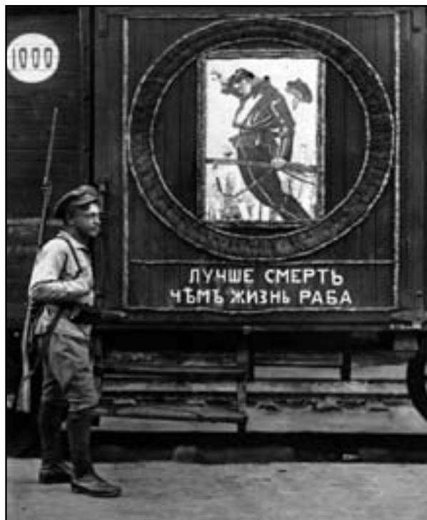
Text na jedné z čs. těplušek na Sibiři hlásá „Lepší smrt než život otroka“ (1918)