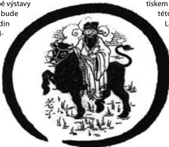
obrázek Starý muž