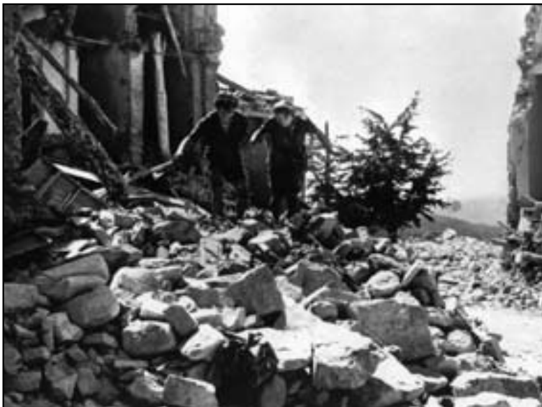
10. 6. 1944 – uprchlíci ze San Pancrazia se vrací, aby hledali své příbuzné