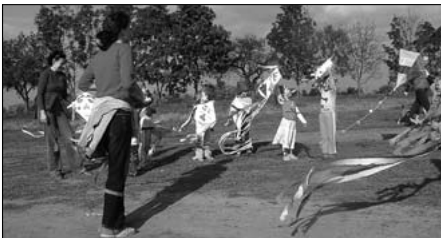
Či drak je hezcí?

strništěm to u těch nejmenších platilo doslova)! Po náročném programu se ve stanu spinkalo, jako když do vody hodí.