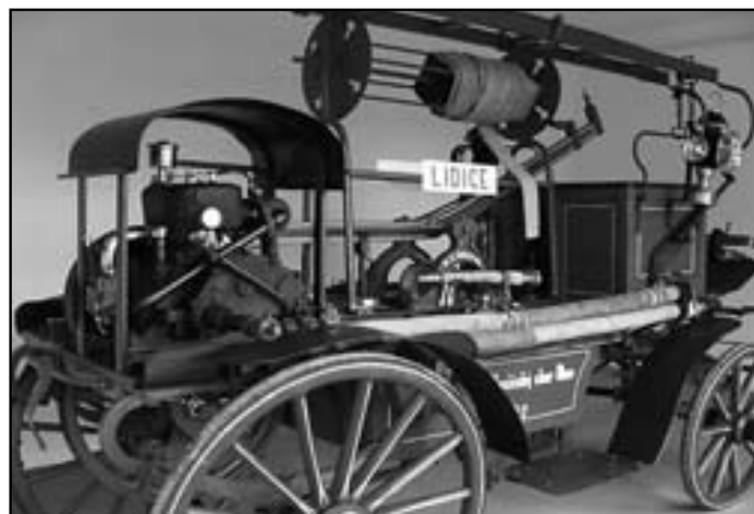
Hasičská stříkačka po renovaci v roce 2006

dveřmi se zastaví snad každý a stříkačku si nechá ujít jen málokdo, a to ještě proto, že je umístěna mimo hlavní prohlídkový okruh. Jejich prostřednictvím se vlastně historie Lidic jeví jako „zmuzealizovaná“, byť se jedná pouze o dva předměty. A tak lze na tomto zvláštním, ba svým způsobem kuriózním případě doložit význam autentických dokladů pro sbírku, která se jinak bez takových předmětů musela obejít. Myslím, že při návštěvě lidického muzea opravdu není těžké pochopit, že bez hasičské stříkačky a kostelních dveří by to nebylo ono, prožitek z expozice by byl prostě jiný, méně působivý. Zároveň však okolnostmi vynucený model lidické muzejní expozice říká i to, že k dosažení kýženého efektu (návštěvníckého prožitku) není v určitých případech třeba autentickými exponáty v muzejních expozicích plýtvat jen proto, že jsou k dispozici. Dva exponáty, které jsou jedinečné, váží se k nim poutavé příběhy a plní funkci symbolů, dokáží vyvolat stejný, ne-li silnější prožitek než desítky exponátů, které více či méně hovoří pouze za sebe nebo jen opakovaně dokládají již doložené, a to formou „otevřeného depozitáře“. Máme tak co činit se zajímavou situací i z hlediska muzejní selekce a tvorby sbírek. Možná by byla „muzealizace“ Lidic vhodným tématem pro některou ze studentských prací absolventů muzeologie.