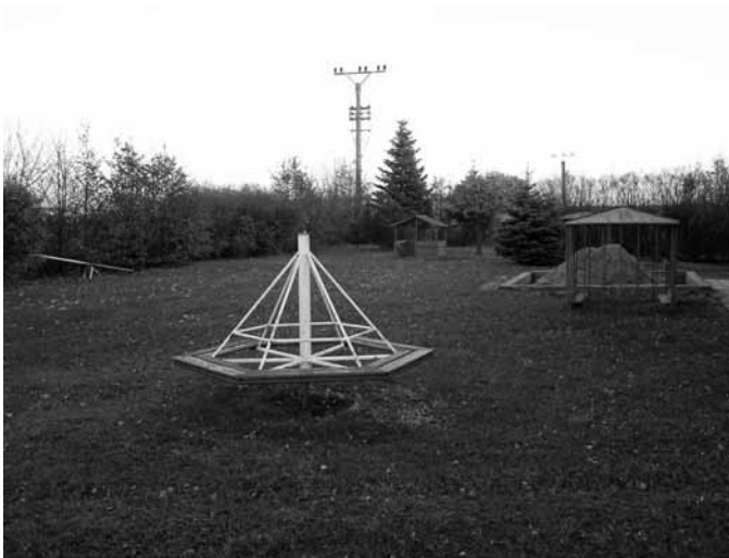
Stávající stav herních prvků na zahradě u MŠ.

To, co děti mají nejraději - sedátkové houpačky, koločoch, herní domečky, pískoviště a herní sestava s klouzačkou, provazovou sítí a hasičským skluzem. Na zahradě u MŠ stojí 2 dřevěné herní domečky, které budou zrenovovány, 2 domečky z ocelových trubek budou odstraněny, stejně jako starý rozbitý a nevyhovující kolotoč a vahadlová houpačka. Obě stávající pískoviště budou opatřena dřevěnými obrubami, písek bude chráněn sítí. Pokud získáme dostatek financí, chtěly bychom doplnit hřiště o pergolu, která by zastíňovala část herní plochy. Rozpočet na celkovou realizaci hřiště a nákup herních prvků se pohybuje kolem 375 tisíc korun. Chceme tímto také poděkovat tatínkovi, který pomáhá s úpravou pískoviště a Mateřskému centru Buštěhradský pelíšek, které za zbylé finance z projektu hřiště Pelíšek (realizace duben 2006) již zakoupilo na toto hřiště sedátkovou houpačku v hodnotě 51000,-. První finanční dar také přislíbil Autobazar Štěpánek.