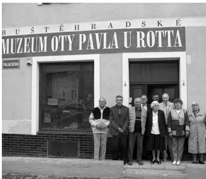
Třída ročníku 1929/1930 před muzeem.

Speciální návštěvníci v muzeu v květnu 2006: návštěva žáků třídy (roč. 1929/1930), do které chodil v letech