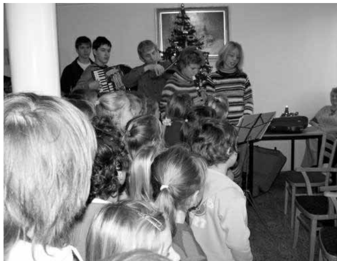
Návštěva dětí v DPS.