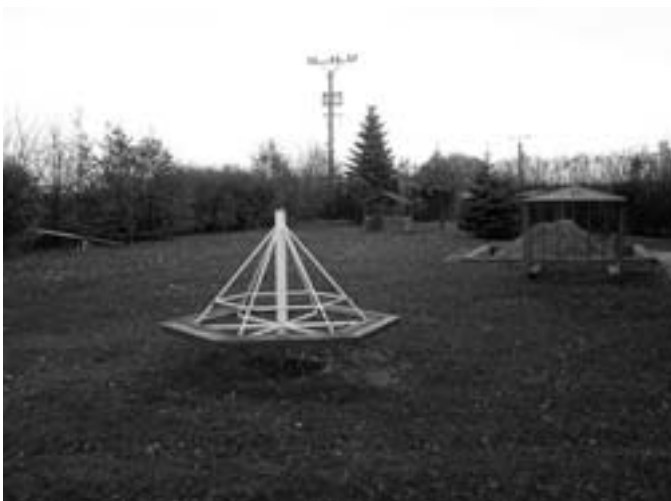
Stávající stav herních prvků na zahradě u MŠ.