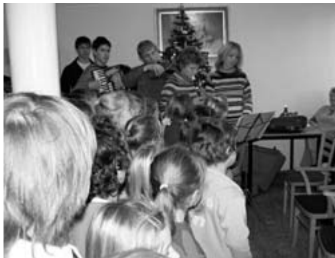
Návštěva dětí v DPS.