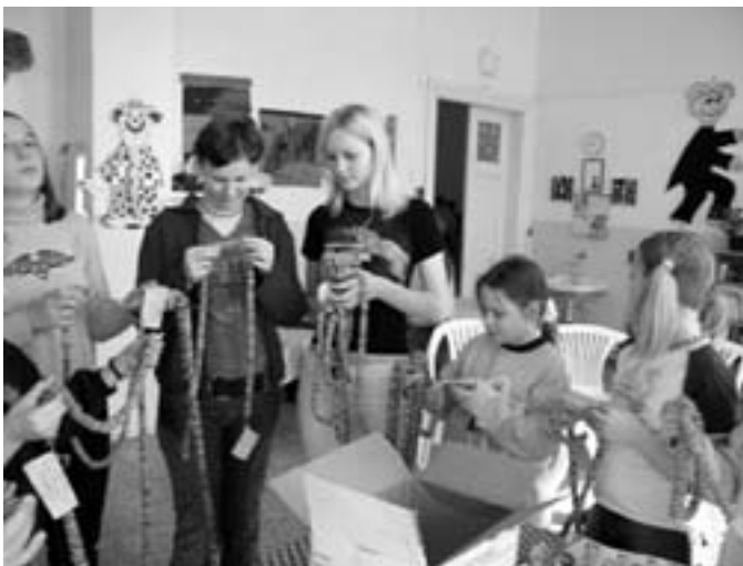
Dárky z Peru