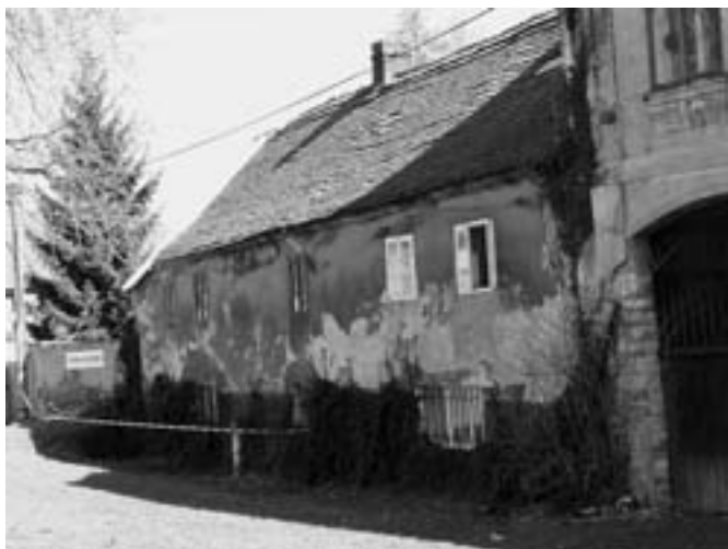
Dům č. p. 93.

Je to trochu krutý paradox, ale často je dům uchráněn v autentickém stavu pouze proto, že vlastník nemá peníze na jeho modernizaci. Takový je osud i celých oblastí - například v bývalých Sudetách, kde lidé často neměli peníze, vztah k domům, které sami nepostavili, ani chuť do nich investovat, se zachovalo obrovské množství krásných, leč zchátralých domů. Oproti tomu třeba na Jižní Moravě lidé měli víc peněz i vztah ke svým domům, což mělo za následek jejich neustále opravy, přestavby a zkrášlování, takže pěkných starých domů je zde již poměrně málo, skoro všechny mají vyměněná okna, nové omítky a zmodernizované interiéry.