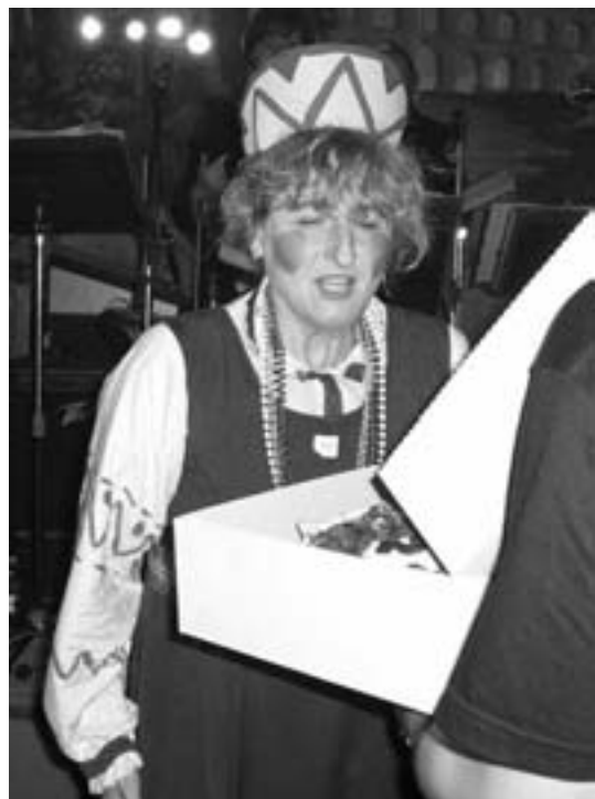
Nejlepší maska - Marfuša