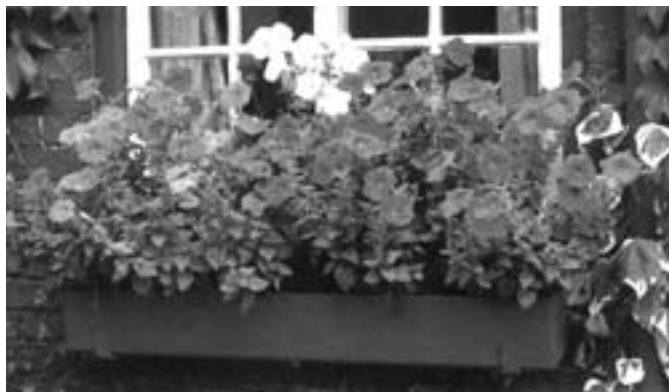
Reprodukce z knihy M. Clarkové: Encyklopedie zahrádkáře, Cesty 1997.

Zkusme letos překvapit okolí nějakým novým pěstitelským úspěchem. Ale pozor: při výběru nových květin je třeba zohlednit mnoho faktorů. Například orientaci oken: na severní straně rozhodně nepokvetou květiny, mající rády celodenní sluneční svit a naopak. Důležitá je též velikost nádoby a náročnost zvoleného druhu na zálivku. Nemáme-li každý den čas, který bychom chtěli věnovat zalévání, bude ideální použít samozavlažovací truhlíky. Nádoby a truhlíky volíme pokud možno jednoduchých tvarů a nejlépe, a na to kladu důraz, z terakoty (pálené hlíny). Na zahradu je nevhodnější a jako přírodní materiál i nej-