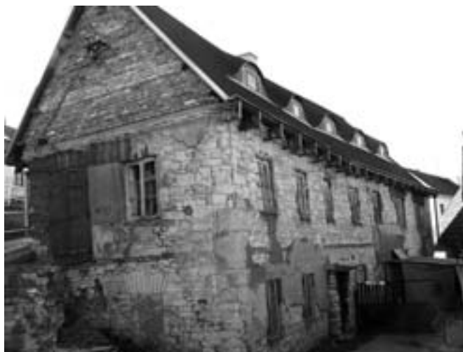
Dům č. p. 117.