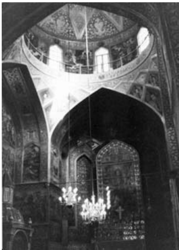
Interiér mešity Sépah-salár

Ale opusťme lesk diamantů a smaragdů a vraťme se k Teheránu, především z pohledu historických staveb. Sem