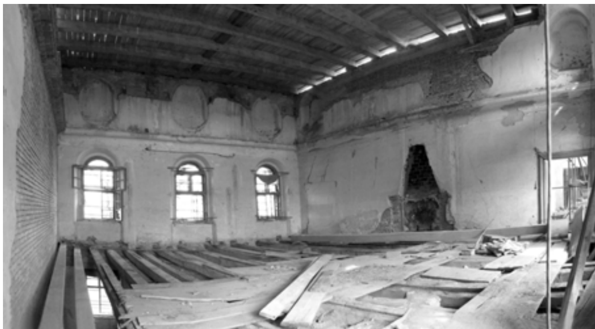
Zámecký sál již bez lešení, s novým stropem.