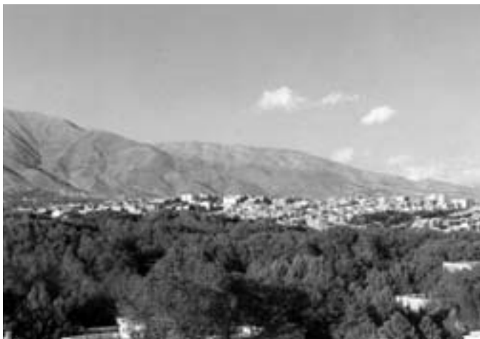
Pohled na severní část města Teherán