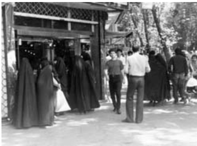
Nakupující Íránci- Teherán

to, že by se mohlo znečistit množství překrásných perských koberců, kterými je podlaha mešity pokryta a na nichž probíhají modlitby muslimů, ale jde o jeden z religiózních prvků islámského náboženství. Apokud k modlitbě směji přijít i ženy, musí být zahaleny, a to doslova, od hlavy až k patě tzv. "čadrem", látkou černé barvy, kterou žena zakrývá nejen hlavu, ale i tvář a vlastně i celou postavu. Je nemyslitelné, aby ženy absolvovaly modlitbu k Alláhovi v jednom prostoru spolu s muži. Uvnitř mešity jsou pro ženy vyhrazeny zvláštní prostory. A tady jsme již u islámu, náboženství, o kterém snad někdy příště také pohovoříme.