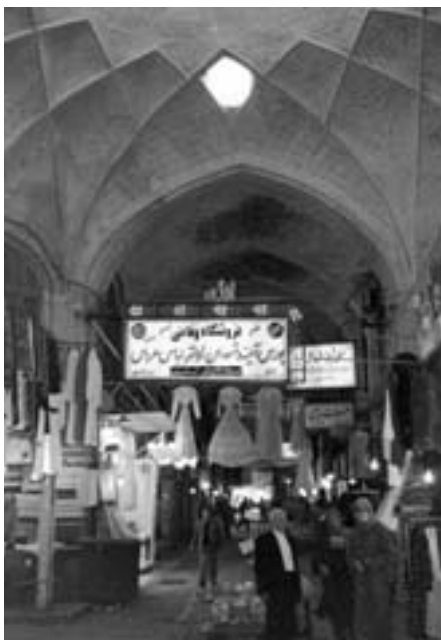
Vchod do Velkého bazaru

Teherán má v porovnání s takovými městy, jakými jsou Isfahán, Šíráz, Mashhad, Tabriz či svaté město Gom, nejméně orientální vzhled. A proto se dotkneme jen toho nejzajímavějšího. Patří sem např. mešita Sépáh-Sálár, která je největší mešitou Teheránu. Byla postavena z trosk slavné mešedské (město Mashad) mešity, která byla zničena zemětřesením. Je klasickou ukázkou architektury z doby dynastie Kádžárů. Projdeme-li branou mešity na nádvoří, uvidíme mihráb (oltář), směřující k Mekce. Vnitřek mešity působí skromným, ale zároveň impozantním dojmem. Nelze hledat jakoukoliv paralelu či podobnost s kostely či chrámy tak, jak je známe v Evropě. Před vstupem do vnitřku mešity, kam zpravidla smějí jen muži, je třeba odložit obuv, ne snad pro-