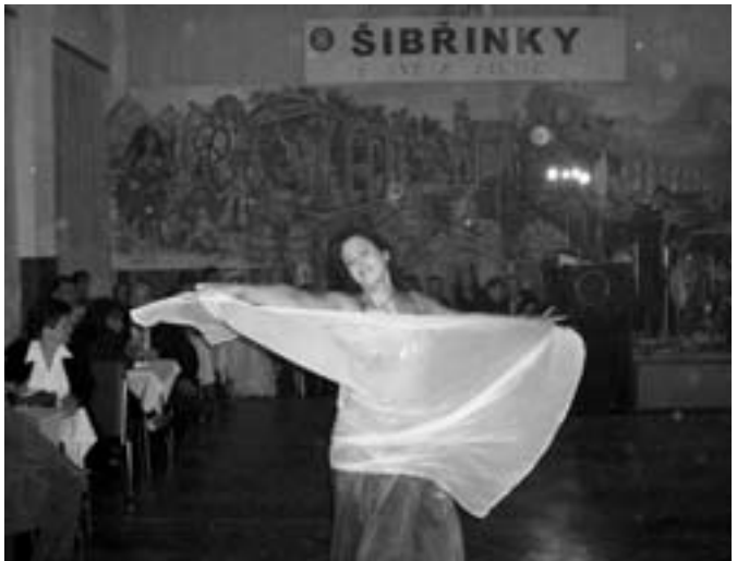
Ukázka břišního tance

Nyní je také čas představit i druhé předtančení, jež bylo ve stylu Orientu. Vystoupila břišní tanečnice, která předvedla 12minutové vystoupení na tři krásné písně a svými ladnými pohyby na sebe upoutala nejedno mužské oko. Dokonce věnovala i jeden autogram. I toto předtančení sklídilo obrovské ovace. Po několika písních, mezi něž opět patřil i Letkis, přišlo dlouho očekávané vyhlášení nejlepších masek večera, které byly sladce odměny. Dortík za třetí nejlepší masku večera si odnesla "stařena", jež během vystoupení břišní tanečnice byla její velkou konkurentkou a přidala se k ní, když chtěla pouze přejít přes sál. Druhou sladkou odměnu si odnesla Marfuša, která se po celý večer starala i o úklid, neboť její dlouhý cop zaručoval zahlazování stop a zametal nám tak parket. A jako první skončil