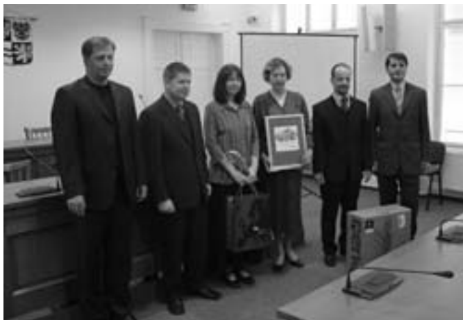
Předávání ceny na Krajském úřadě v Praze.

Fakt, že jsme - ač nevelké městečko - v krajském kole mezi ostatními městy uspěli a stránky Buštěhradu