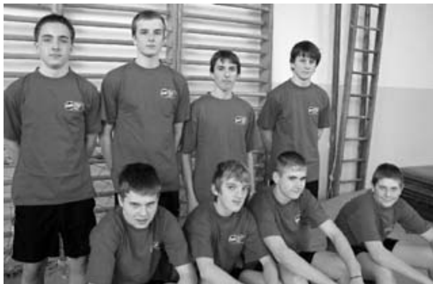
Naši sportovci.