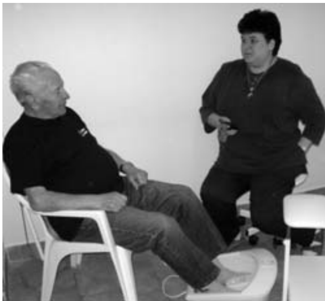
Nová provozovna pedikúry v DPS.