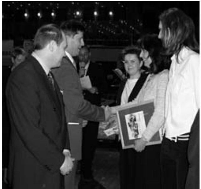
Předávání ceny v Hradci Králové.