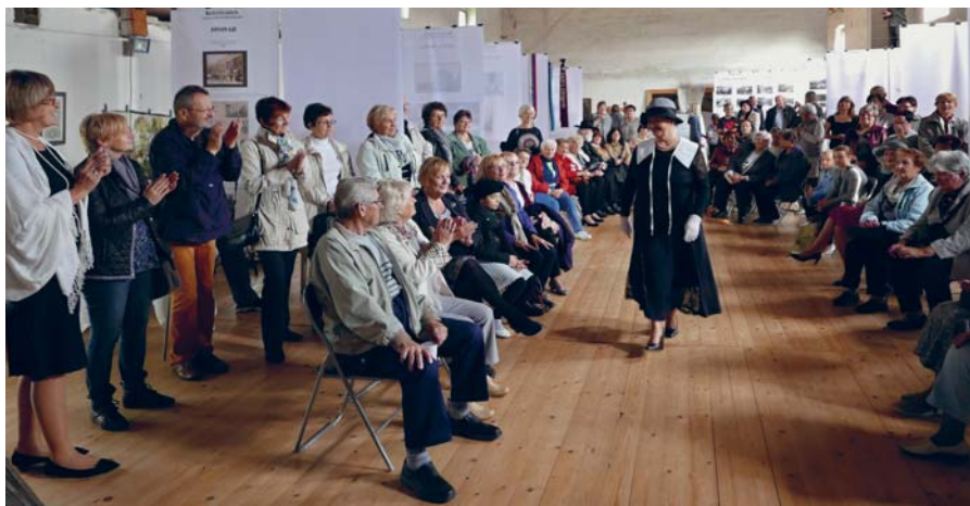
PŘEHLEDKA KLOBOUKŮ Z DOB PRVNÍ REPUBLIKY.

Přístup k mohutné sýpce není právě komfortní. Přes staveniště. Ale když se dostanete po prašné cestě před mohutnou stavbu, vidíte na první pohled, že tady to žije. Před vinotékou postávali a posedávali štamgasti a kolem vchodu do sýpky se rojili návštěvníci. Vylezl jsem po schodech nahoru do patra a tam bylo několik desítek dalších. Výrazně převažovali lidé starší, jak se dnes říká, senioři.