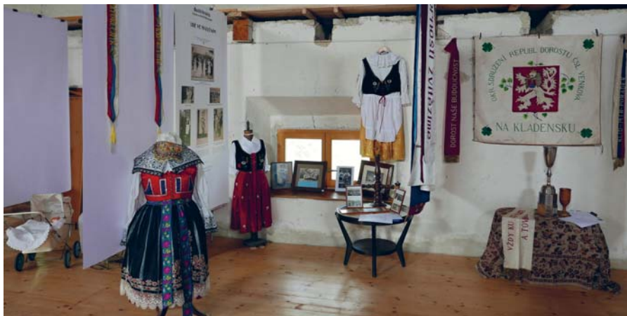
I TAKOVÉ SKVOSTY PŮJČILI LIDÉ NA VÝSTAVU.

Slavnostní pásku výstavy přestříhla paní starostka někdy ve čtvrt na čtyři a hodinu a půl pak stále početnější návštěvníci už všech věkových skupin obdivovali instalaci výstavy, předměty zapůjčené spoluobčany – a vzpomínali. A také chválili obcerstvení připravené Věčně mladý-