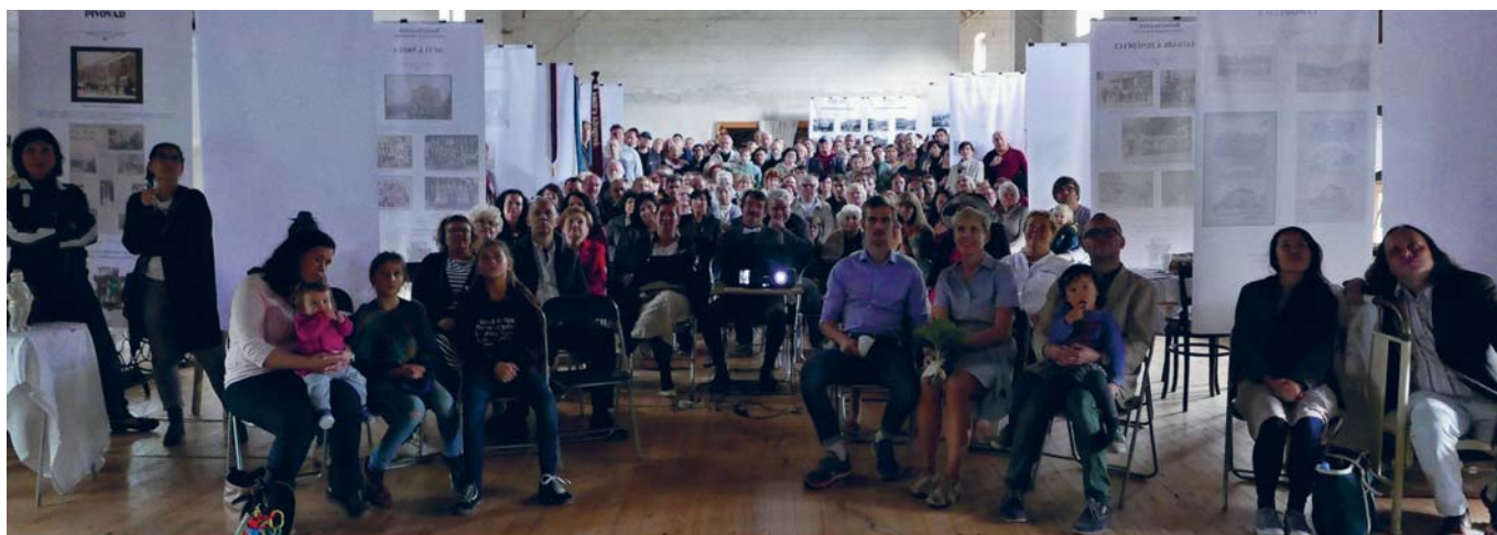
NABÍTÝ SÁL PŘI PROMÍTÁNÍ FILMU BUŠTĚHRÁDEK.