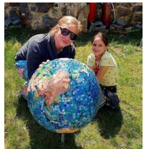
K vidění byla i mozaiková zeměkoule, foto David Zabilka