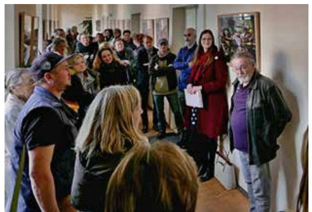
Vernisáž výstavy fotografií v 1. patře zámku Buštěhrad