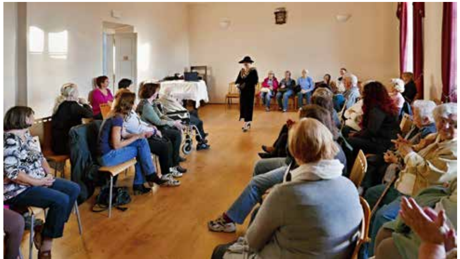
Modní přehlídka v zámeckém sále

Půjdeme-li podél kostela a mineme ve výklenku „uložený“ originál toskánského mariánského sloupu z počátku 18. století (jehož replika stojí v křižovatce ulic Kladenská a Revoluční) a vstoupíme pod podloubí, hned za prvním oknem ještě můžeme vidět pana učitele se svým žákem, kterého připravuje pro život s kytarou. Mineme knihovničku s bohatou nabídkou knih, které už se někomu nehodí, tak je věnoval těm, komu ještě udělají radost. Všichni víme, že v rohu pod podloubím najdou městskou knihovnu , o jejíž provoz se ochotně stará Drahomíra (Dáda) Čermáková.