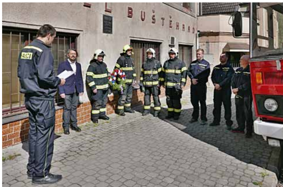
Pieta za umučené buštěhradské hasiče