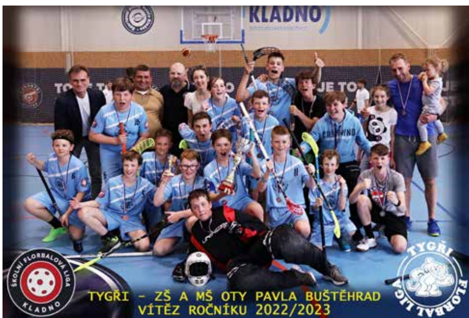
Florbalisté z naší školy

Možná se nezúčastněným čtenářům může zdát, že se zase tak nic výjimečného nestalo, že se jedná jen o sport a že to byla jen jedna výhra v nějakém turnajíčku pár základek. My, kteří jsme ovšem dlouho toužili, poctivě se připravovali, kousali porážky, abychom se nakonec spojili ve vítěznou partu, víme své, a nám tento úspěch zůstane v srdcích jako naše malé florbalové Nagano.