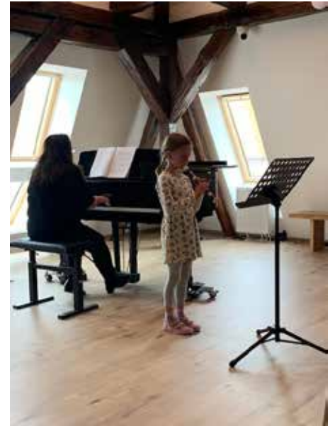
Koncert poboček

hlavně pro radost. No a tím nejoblíbenějším je určitě Koncert rodičů, učitelů a žáků. Každoročně jen pro tuto příležitost vzniknou nečekaná seskupení hráčů a nejinak tomu bylo i letos.