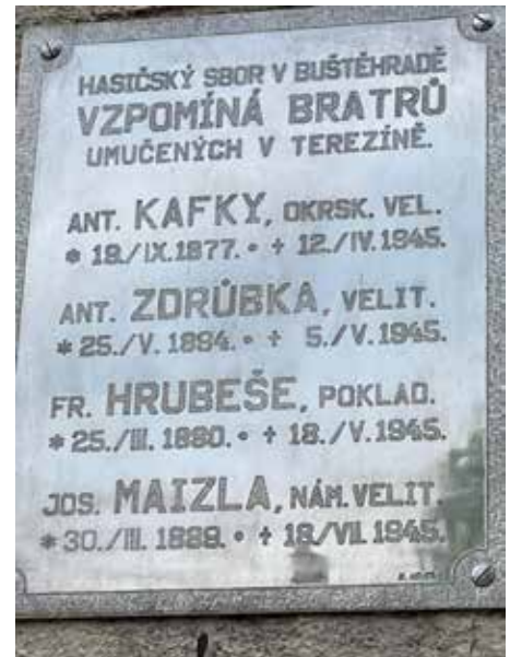
Pamětní deska umučeným hasičům