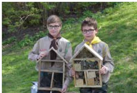
Skauti a jejich hmyzí domečky