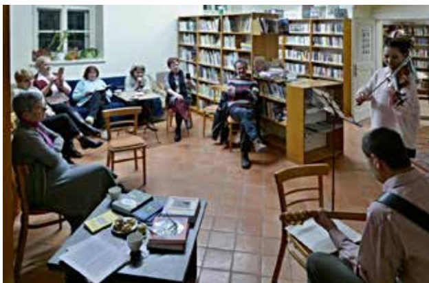
Kulturní akce v Městské knihovně

Velice důležitou součástí podloubí v přízemí je infocentrum . Bylo založeno před pěti lety za účelem poskytování informací návštěvníkům a obyvatelům našeho města. Jenom pro představu, v loňském roce se o radu na něj obrátilo osobně 2 654 tuzemských a 7 zahraničních turistů (za letošní čtyři měsíce turistů 413 + 2). Jsou zde poskytovány informační služby nejen turistům, ale i místním občanům, kteří jsou informováni o všech kulturních, ale i jiných