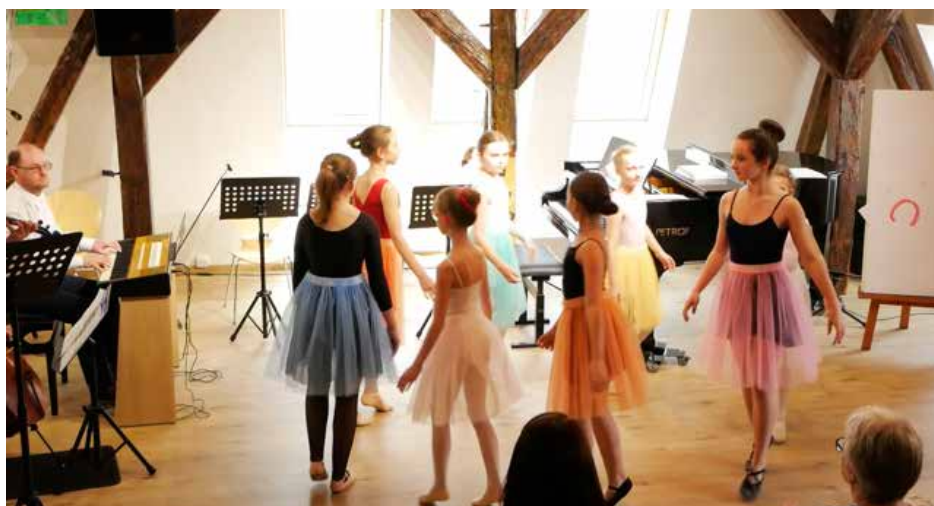
Koncert Živé baroko