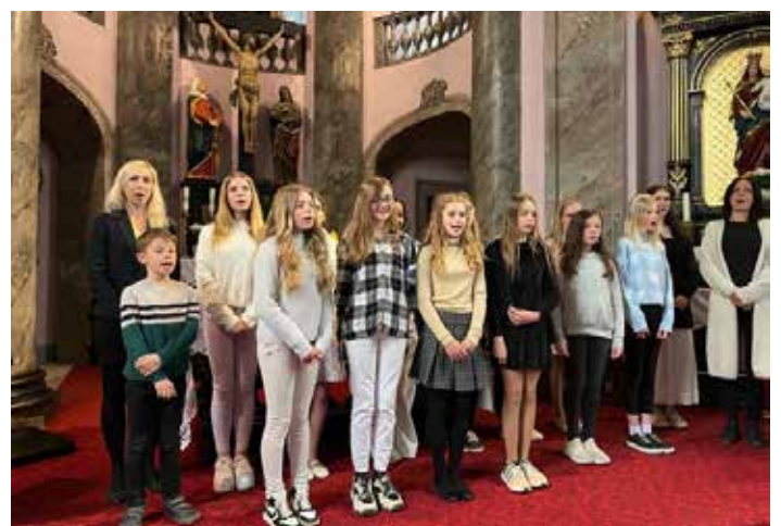
Koncert pěveckého sboru ke Dni matek