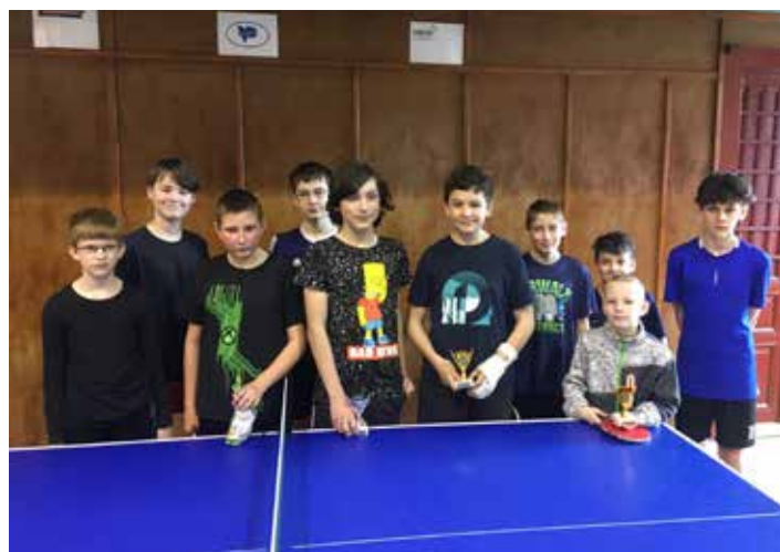
Účastníci Velikonočního turnaje ve stolním tenise - mládežnický oddíl