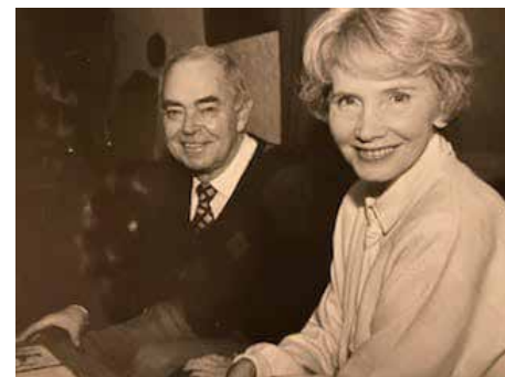
Oba Burešovi byli junáci, skauti... sportovci. A skvělí lidé. On výborný dětský lékař, ona statečná a neúplatná právnička a politička.