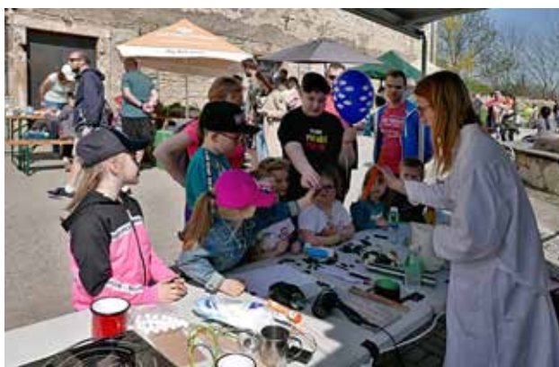
Laborky.cz byli při ukázkách pokusů stále obklopeny dětmi, foto Monika Žitníková