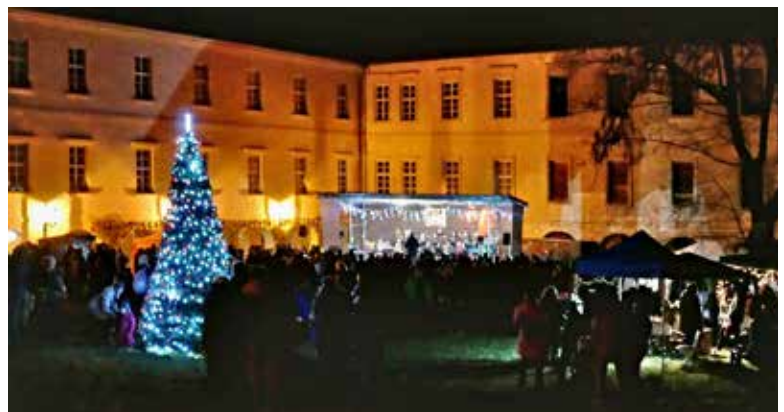
Rozsvěcení vánočního stromu na nádvoří zámku