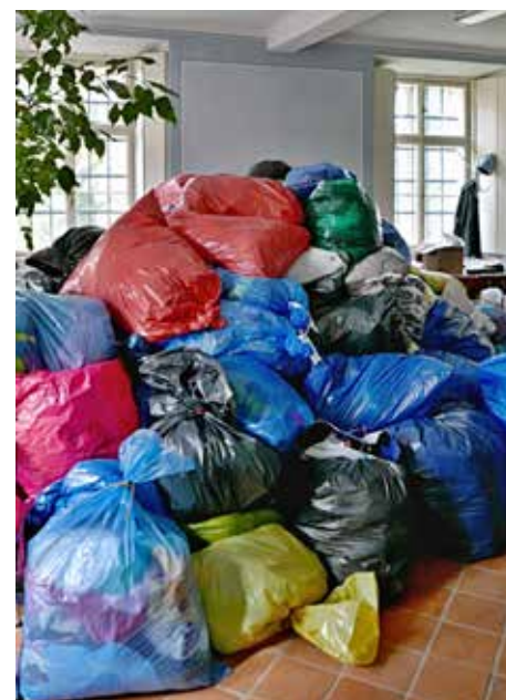
Část z velkého množství, které se opět podařilo díky všem dárcům posbírat