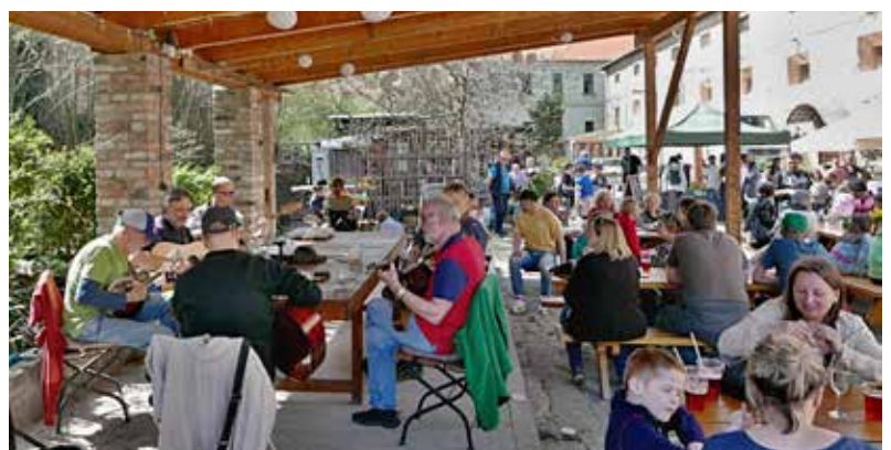
Na akci, kterou navštívilo velké množství lidí, zahrála i Kramle