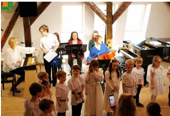
Koncert Živé baroko