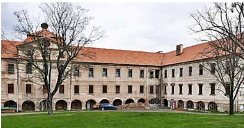
Hromada stavební suti před zámkem