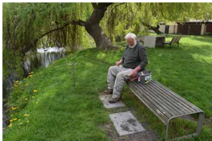
Účastníci veřejného chytání ryb