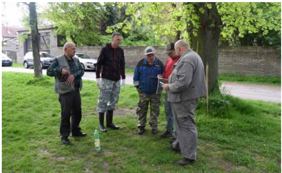
Účastníci jarní brigády