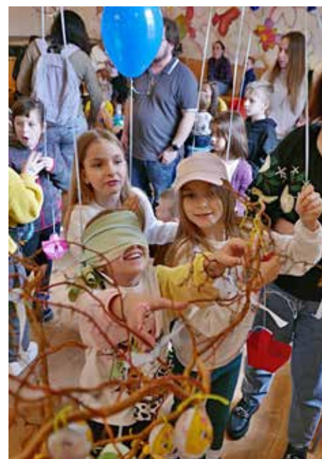
Děti hledají uvázaná vajíčka, foto JP

Po období půstu je oblíbeným velikonočním pokrmem např. u Řeků pečené jehněčí a velikonoční chléb jménem Tsoureki. Srbové si zase dopřávají uzené maso, sýry, vařená vejce, červené víno a rovněž jehněčí maso na několik způsobů. Bulharští vinaři na Velikonoce zahrabávají vejce do půdy, což by jim mělo zajis-