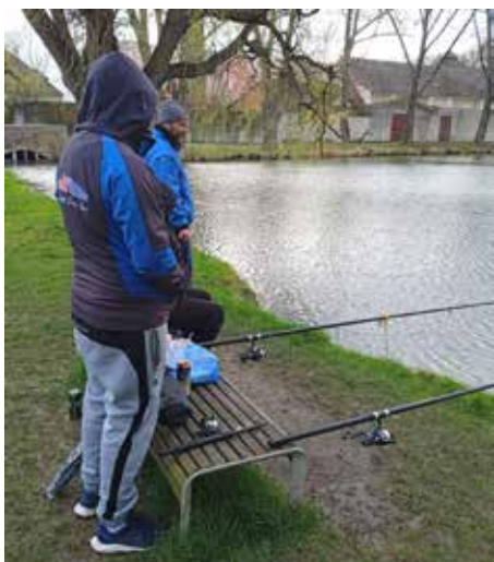
Rybaři se 1. 4. nezalekli nepříznivě počasí a přišli si na rybník zachytat, foto Josef Kotouč

DOUFÁME, ŽE VÁS NABÍDKA ZAUJME A SOBOTNÍ DOPOLEDNE PROŽIJETE TROCHU JINAK