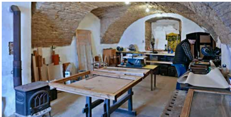
Tomáš Rudčenko ve své dílně