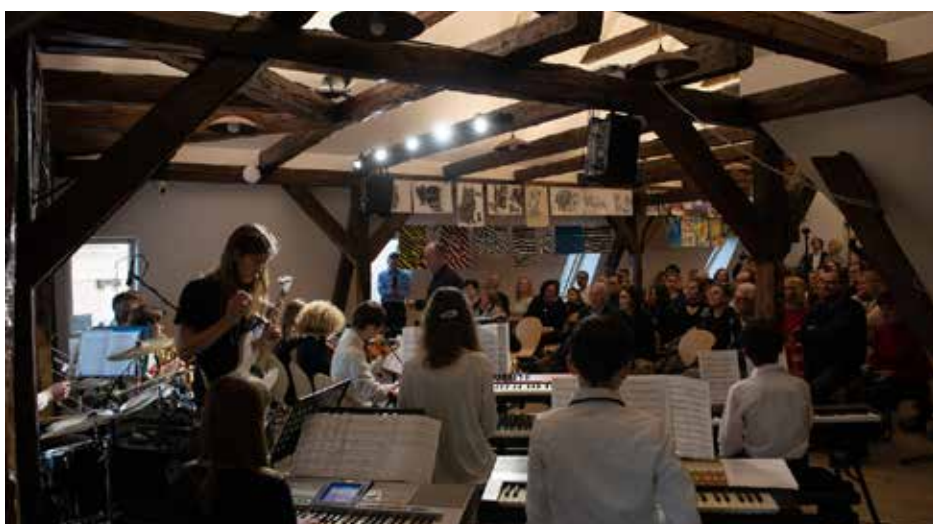
Vystoupení žáků s orchestry ZUŠ