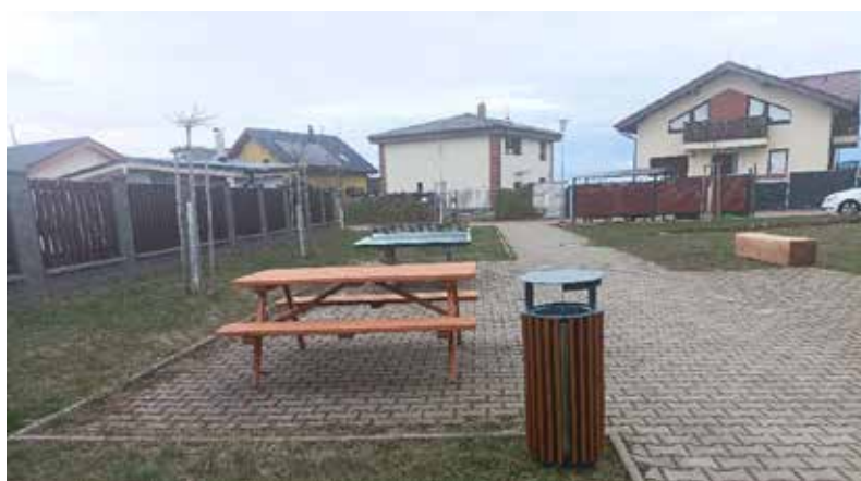
Parková úprava v ulici Olivové