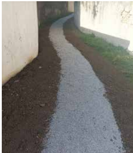
Zpevněná cestička od rybníka k ulici Tyršova

Podle toho, jaký vyjde rozpočet, rozdělíme realizaci pravděpodobně na dvě etapy, první z nich se bude realizovat již letos. Kamery umístíme na nejfrekventovanější místa a tam, kde hrozí nějaké problémy. Budou u základní a mateřské školy, u pošty, u Macíků, před sportovním areálem, u Seifertovny a na hřišti u Pelíšku, na Babkách, v zámeckém parku a na zámeckém nádvoří, u hasičárny a ZUŠky, u Technických služeb, na sběrném místě, u hřbitova. Dále by v Tyršově ulici měly být umístěny i kamery, které dokáží identifikovat SPZ a nákladní automobily. V tuto chvíli jsme limitováni jednak finančně a jednak tím, jak máme po městě vybudované optické trasy. Někde budeme muset použít bezdrátový přenos. Ale domníváme se, že v tomto rozsahu by měl kamerový systém fungovat více než dostatečně.