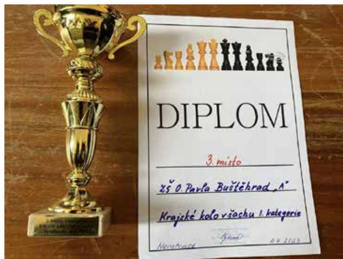
Diplom s pohárem za krásné 3. místo