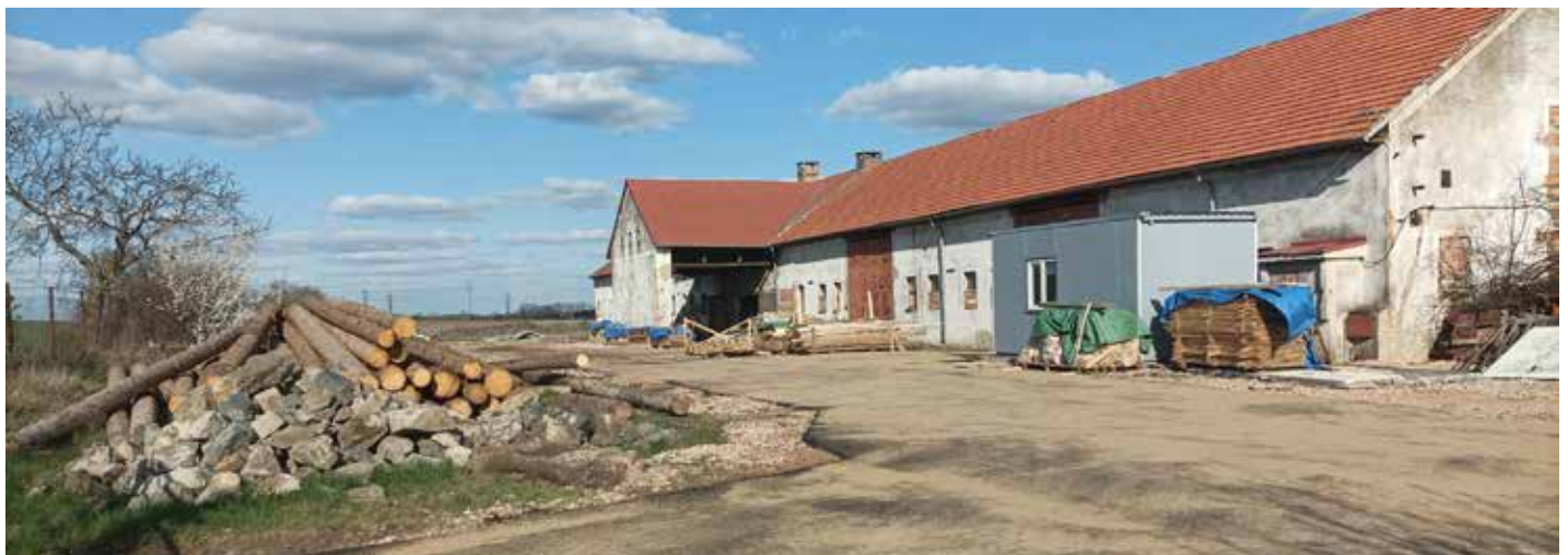
Pilu najdete před výjezdem z Buštěhradu směrem na Stehelčevy, foto LZ