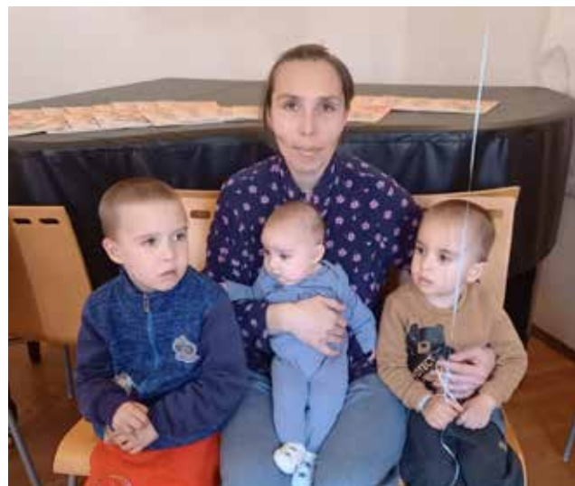
Maminka odpočívá s třemi ze svých pěti dětí