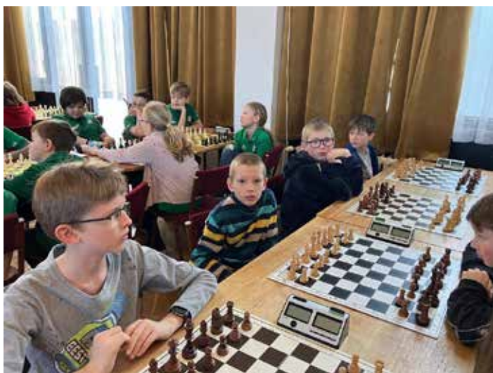
Účastníci přeboru škol v šachu, foto Jiří Charvát