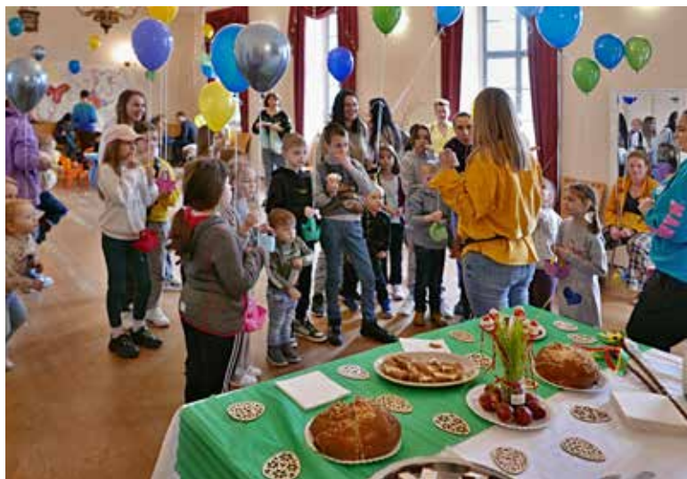
Malí i velcí se skvěle bavily, foto JP

tit dobrou úrodu a ušetřit je krupobití. Tradičním velikonočním jíd-