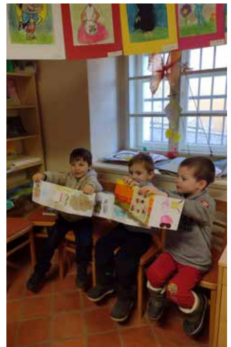
Děti ukazují leporelo, které samy vytvořily