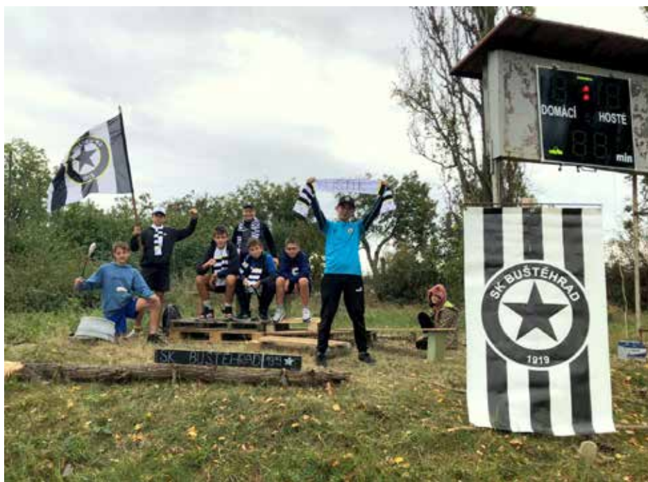
Buštěhradský mladý fanklub při derby s Hřebčí

nás odměnil. Střídající hráč a naše mladá posila Ondra Frýdl zatáhl míč po levé straně a dal do vápna, tam po závaru, přímou ranou Čečetka srovnal na 1:1. Neuvěřitelné. A to ještě nebylo vše! V nastavení po stejné ose z podobné akce a opět po závaru ve vápně přidal Vávra vítězný gól na 2:1. Výbuch radosti! Smutek vystřídala euforie z vítězství. Porazili jsme favorizovanou Hřebeč a posílili svoji pozici v popředí tabulky. Tabulka je ve předu vyrovnaná a o čelo bojují hned čtyři týmy. Buštěhrad má oproti nim ale výhodu jednoho zápasu navíc. K zápasu s Hřebčí ještě nutno podotknout, že tým k vítězství tlačil kotel fanklubu, který je složen z buštěhradské mládeže. Ti si na hřišti vybudovali vlastní tribunu a v barvách klubu bouřlivě tým celý zápas povzbuzovali. Po zápase byli za svůj výkon odměněni poděkováním hráčů na otevřené scéně. I hráči se dočkali bouřlivého potlesku od domácích fanouš-