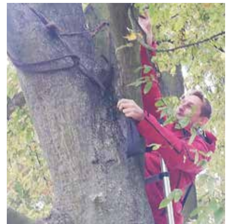
Sejmutí měšce ze stromu