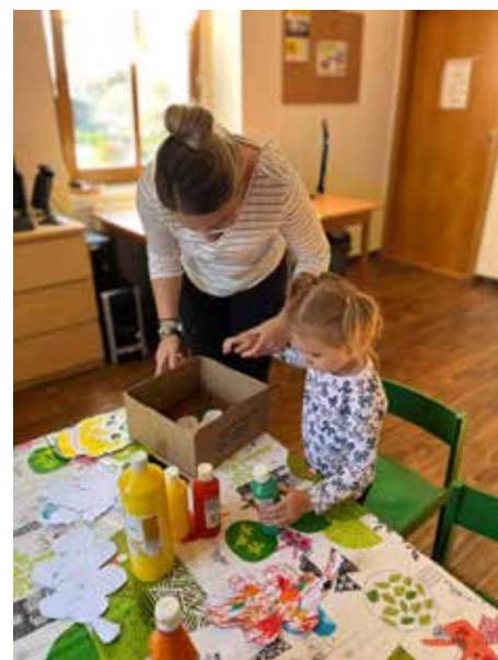
Podzimní smyslohraní – listy

oblíbených aktivit, a protože chceme s Pelíškem držet trendy, zařadili jsme ho do našeho nepravidelného programu formou workshopů. Všechny smysly – ty se konají průměrně jednou měsíčně a vždycky se věnu-