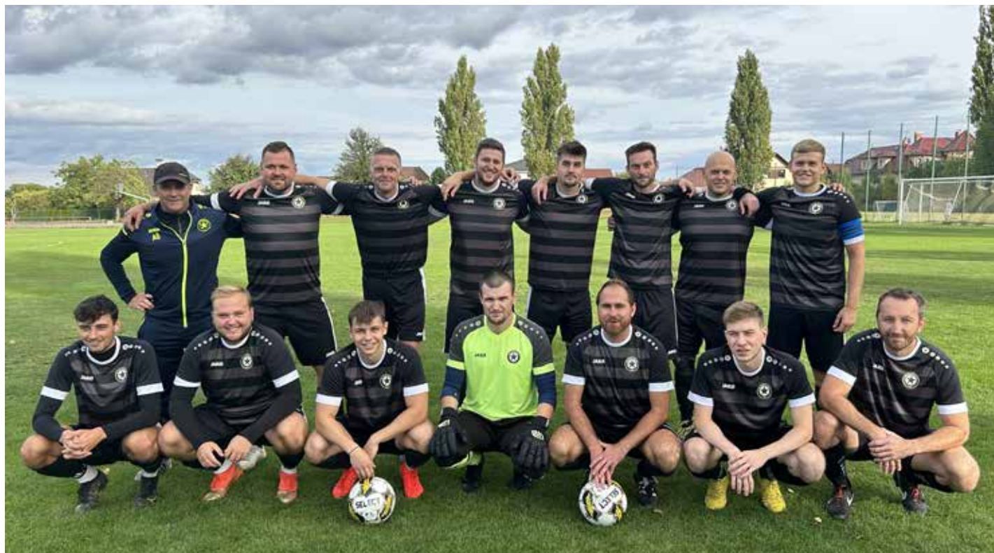
SK Buštěhrad v nových dresech

nás odměnil. Střídající hráč a naše mladá posila Ondra Frýdl zatáhl míč po levé straně a dal do vápna, tam po závaru, přímou ranou Čečetka srovnal na 1:1. Neuvěřitelné. A to ještě nebylo vše! V nastavení po stejné ose z podobné akce a opět po závaru ve vápně přidal Vávra vítězný gól na 2:1. Výbuch radosti! Smutek vystřídala euforie z vítězství. Porazili jsme favorizovanou Hřebeč a posílili svoji pozici v popředí tabulky. Tabulka je ve předu vyrovnaná a o čelo bojují hned čtyři týmy. Buštěhrad má oproti nim ale výhodu jednoho zápasu navíc. K zápasu s Hřebčí ještě nutno podotknout, že tým k vítězství tlačil kotel fanklubu, který je složen z buštěhradské mládeže. Ti si na hřišti vybudovali vlastní tribunu a v barvách klubu bouřlivě tým celý zápas povzbuzovali. Po zápase byli za svůj výkon odměněni poděkováním hráčů na otevřené scéně. I hráči se dočkali bouřlivého potlesku od domácích fanouš-