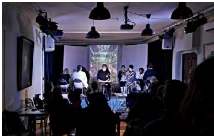
Divadelní představení