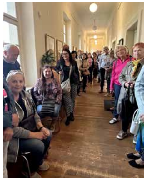
Výstavní prostory praskaly ve švech