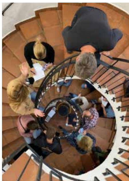
Čtení v Základní umělecké škole (schodiště)

Poté se celá skupina vydala k zámku, kde bylo připraveno čtení v podloubí u Infocentra Buštěhrad. Připraveno bylo i malé občerstvení na zahrnutí žízně a velmi připravena byla i herečka Divadla KiX! Vybrala si knihu od irské autorky Doireann Ní Ghríofa (Přízrak v hrdle) . A i ve svém hrdle si perfektně připravila výslovnost irských názvů a jmen. Třešničkou na dortu bylo, že se ještě zvládla během čtení dvakrát převléknout, a tím se i převtělila do jiných postav.