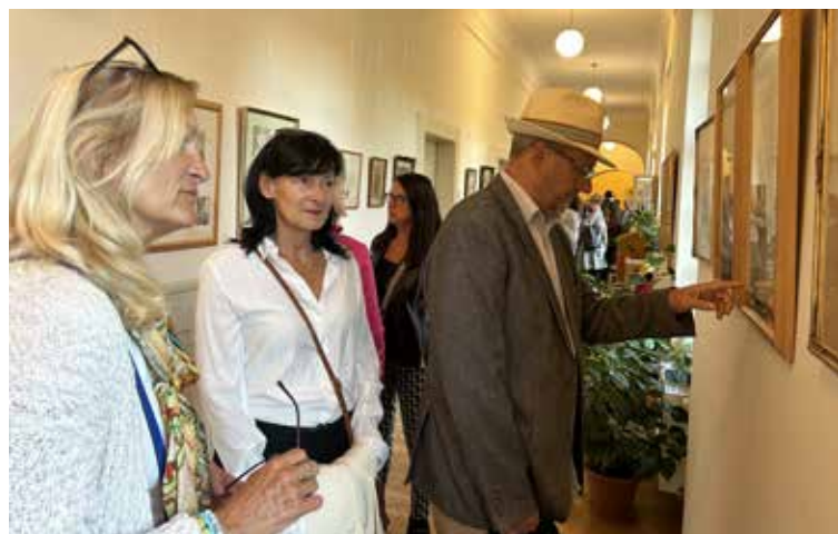
Návštěvníci vernisáže při prohlídce