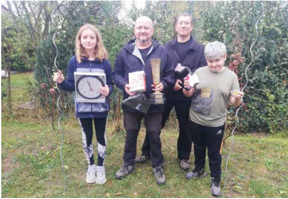
Vítězná posádka jednodenní

zvaná Žůžolabůžo a třetí místo patřilo dámské posádce Jednorožci.