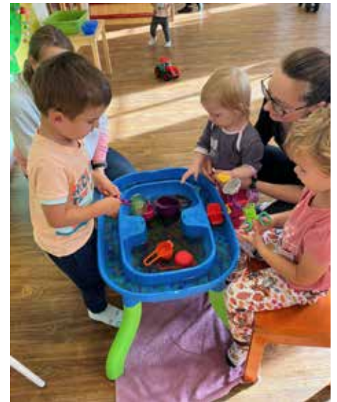
Oblíbené vodní perly na kroužku Kulíšek, foto Kateřina Burget