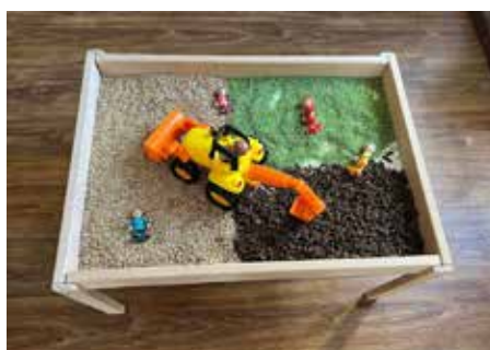
Podzimní smyslohraní připravené pro děti

děti, jak strávit příjemných devadesát minut ve společnosti stejně starých dětí a jejich rodičů. Děti si za tu chvíli vyzkoušejí spoustu různých aktivit od zpívání, pohybu, výtvarky, smyslohraní po rozvoj jemné i hrubé motoriky. Rodiče si tak po Kulíškovi mohou (kromě možnosti sdílení svých rodičovských radostí i strastí) odnést spoustu nápadů, jak během dlouhého období, které nyní budeme trávit častěji doma, své ratoletti zabavit. A právě zmíněné smyslohraní je jednou z aktuálně velmi