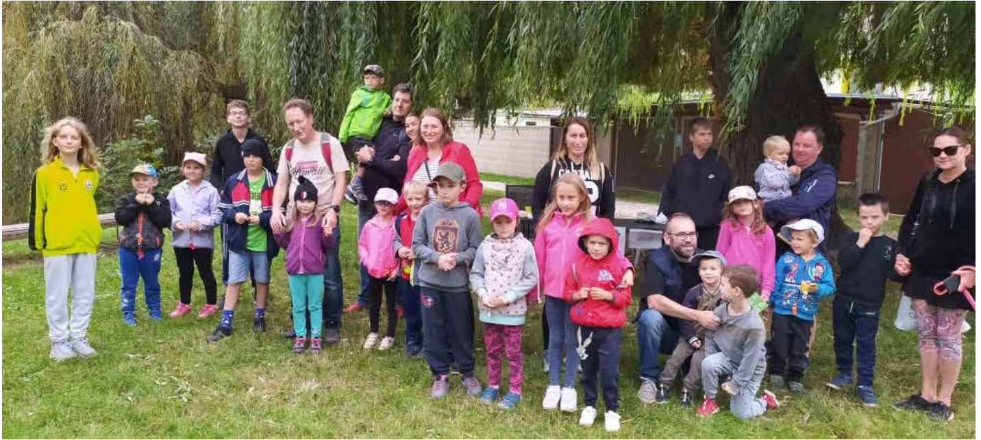
Část účastníků Hledání přemyslovského měšce

hledat měšec, musela úspěšně zvládnout trasu v Buštěhradě. Byla pouze jedna, ale pro malé děti a jejich rodiče mohla být zkrácena. Úkoly na trase zvládly všechny skupinky úspěšně.