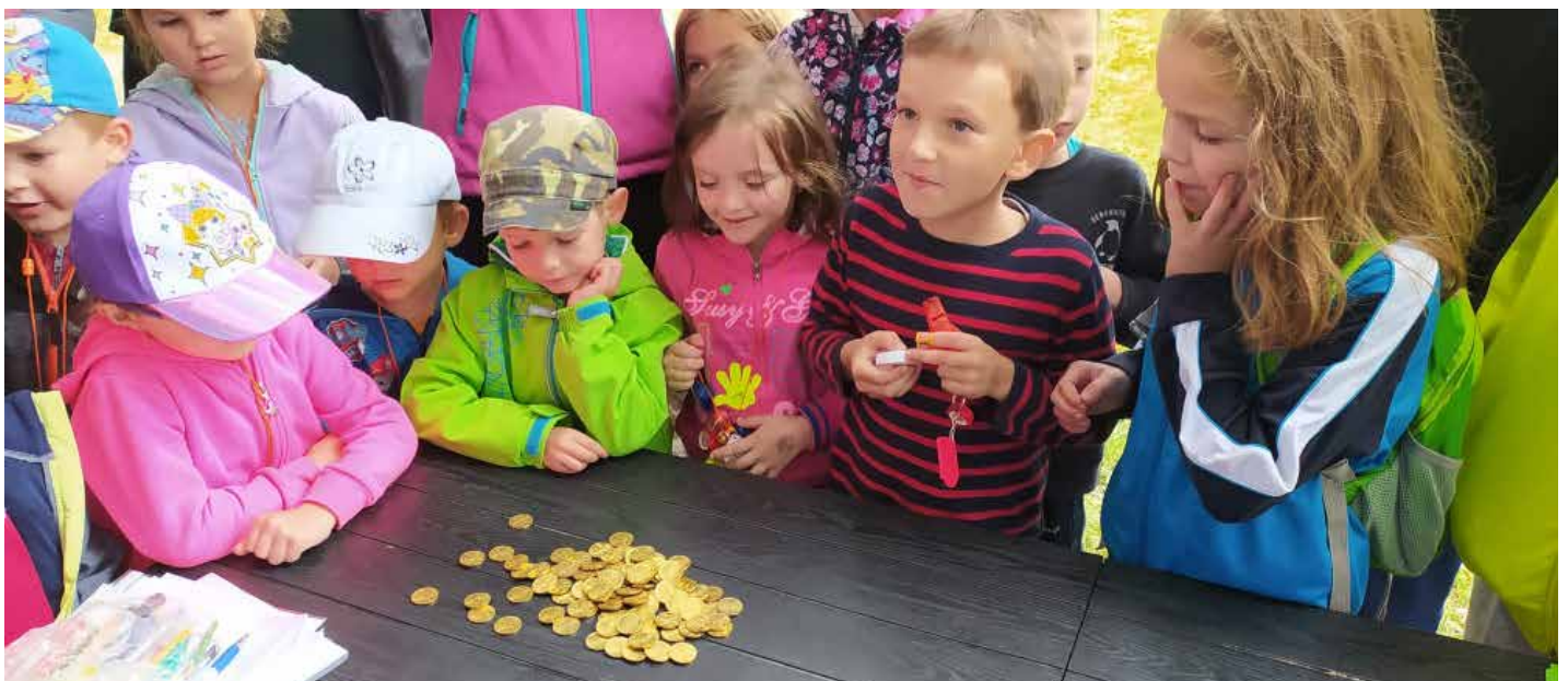
Před rozdělením zlatáků, foto Jiří Janouškovec st.