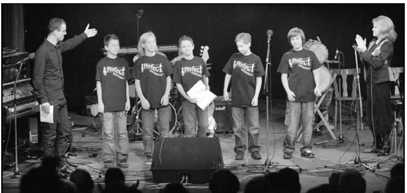
Po nesmělém nástupu na pódium to rockeři pěkně rozbalili