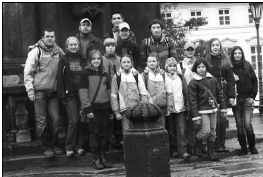
Výlet Berušek a Zálesáků do Prahy 17. 11. 2009

V současnosti má Junák pět oddílů. Dva z nich jsou smíšené – Medvídci a Liščata. Oba sdružují kluky a holky, Liščata od 5 do 7 let, Medvídci od 7 do 10 let. Dále má jeden dívčí oddíl – Berušky, kam chodí holky od 9 do 13 let, a dva chlapecké – Vlky a Zálesáky. Vlčům je