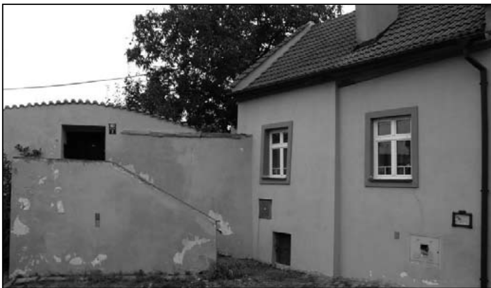
Č.P. 161 – U Bártů