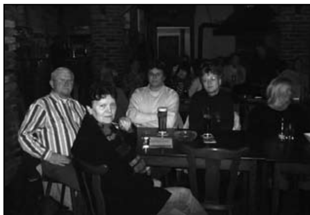
Přednáška o Africe

Posední akce, která se uskutečnila v tomto roce, bylo povídání o knížkách a zajímavých autorech se