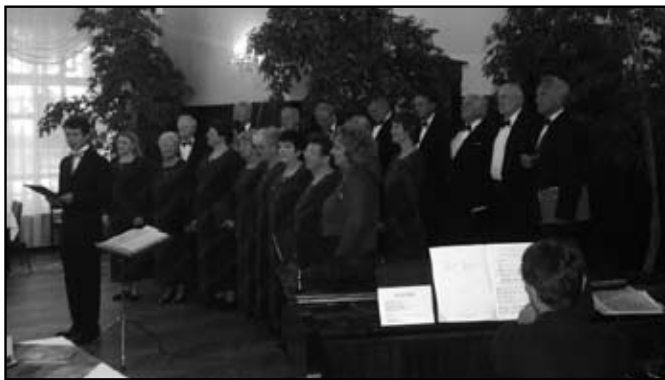
Mšně Lázně, 21. 6. 2008

Smíšený pěvecký sbor působí v naší obci již od roku 1977. Je to amatérský sbor, který sdružuje přibližně třicet zpěváků. Jeho posláním je šířit hudební kulturu a poskytnout uplatnění pro kulturní vyžití lidem, kteří mají zájem o sborový zpěv.