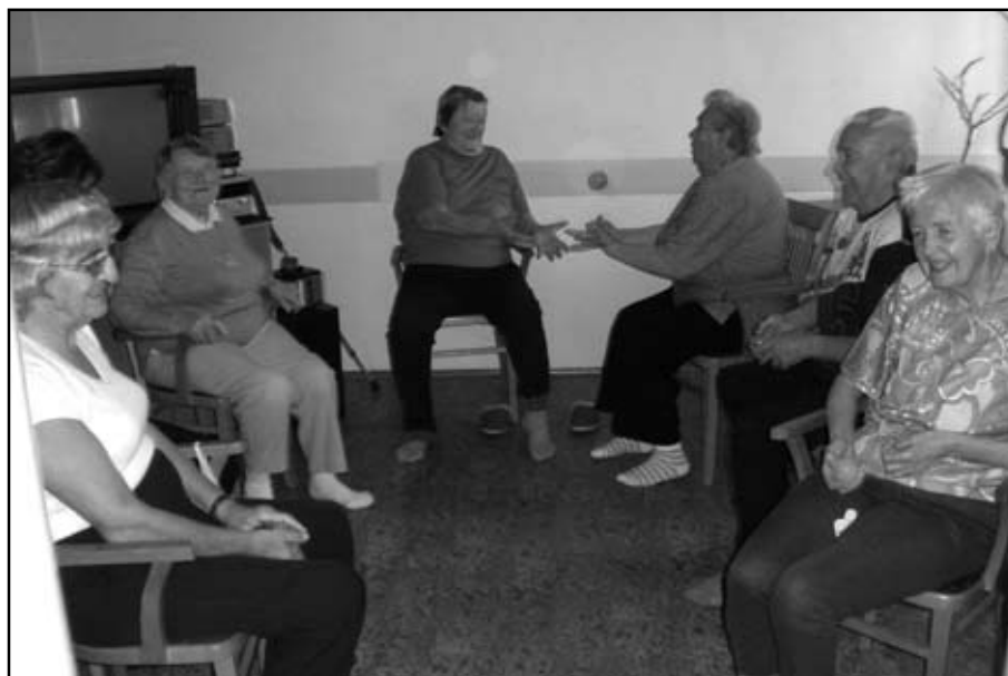
DPS v roce 2009