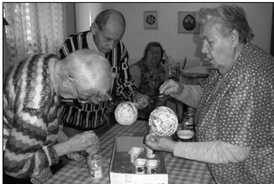
DPS v roce 2009